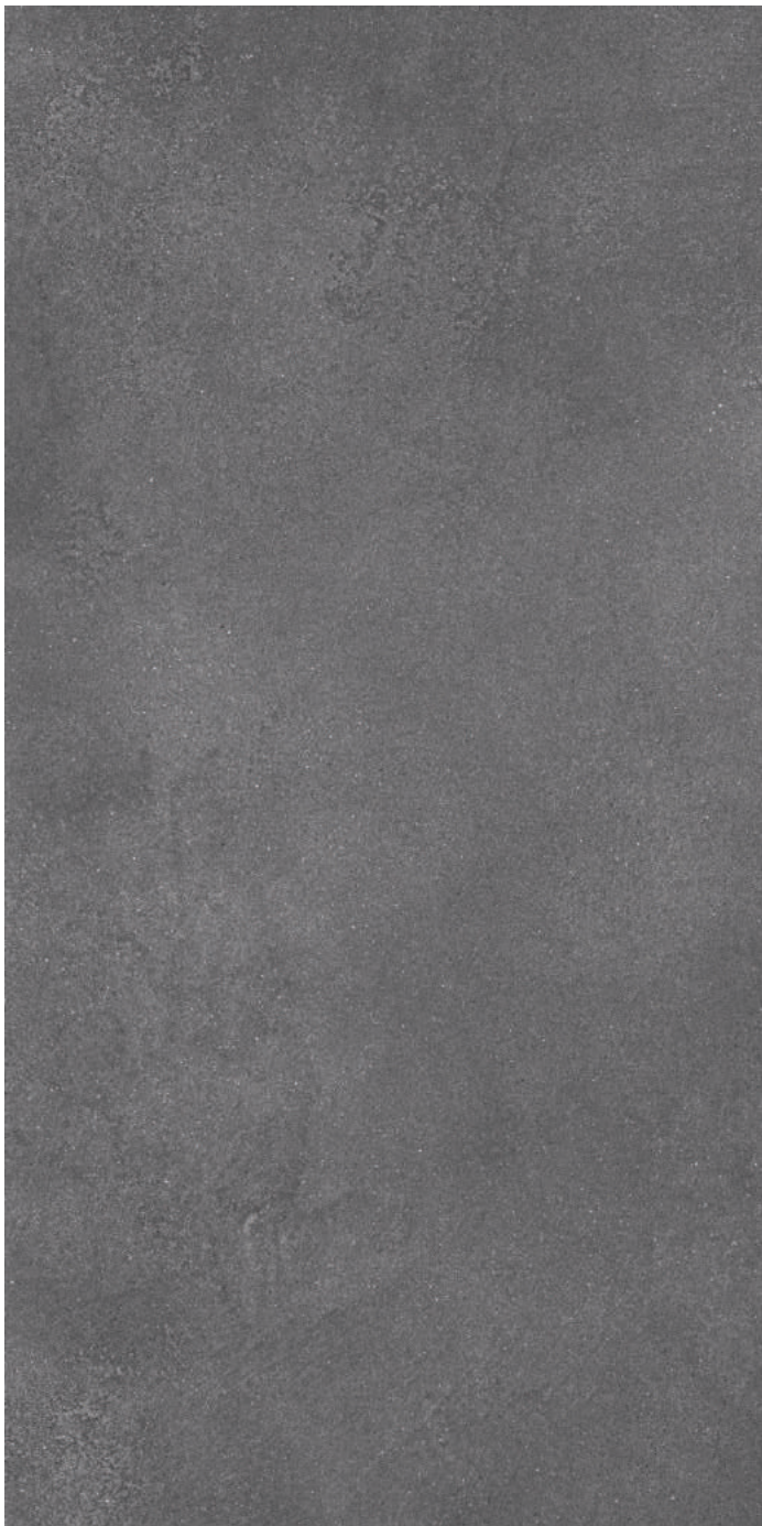
DL571200R Турнель серый тёмный обрезной 80x160 Tournelle dark grey rectified