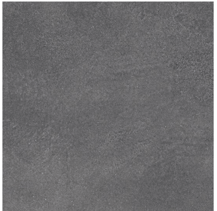
DL840900R Турнель серый тёмный обрезной 80x80 Tournelle dark grey rectified