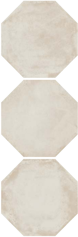
SG243100N Пьяцетта светлый 24x24 Piazzetta light