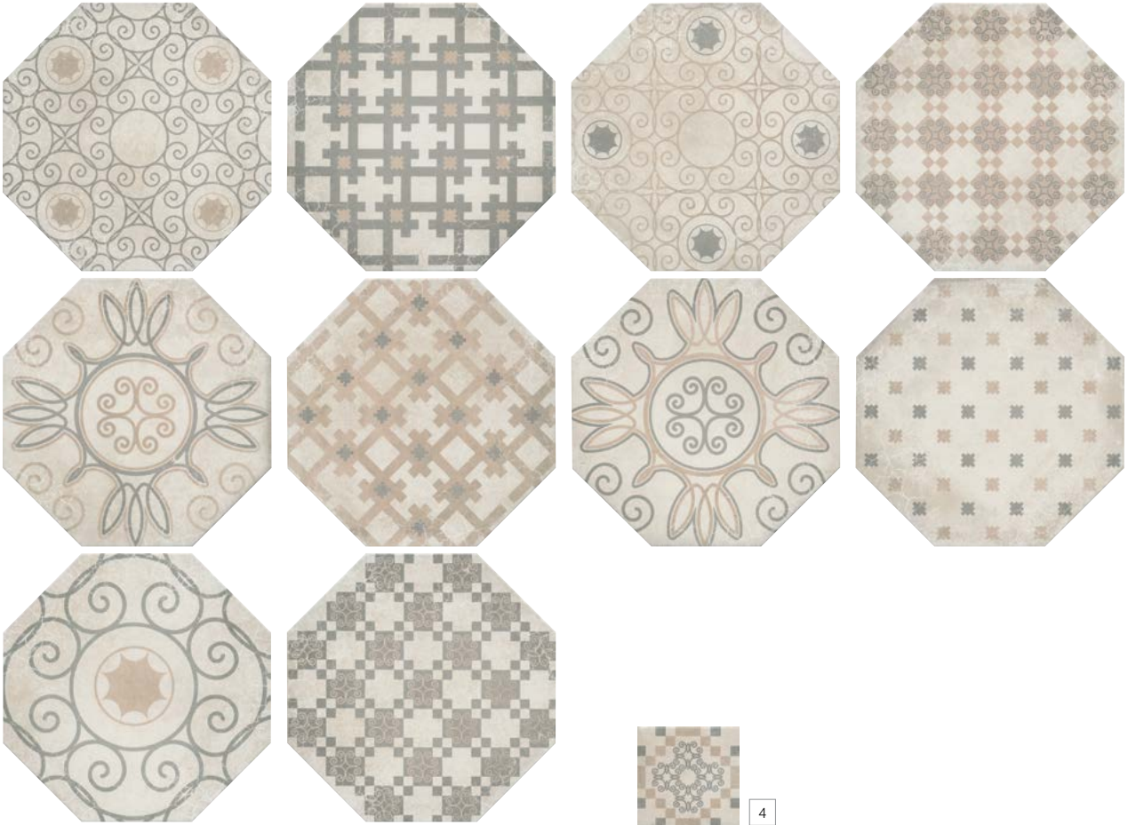
SG243000N* Пьяцетта 24x24 Piazzetta