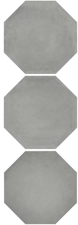
SG243300N Пьяцетта серый 24x24 Piazzetta grey