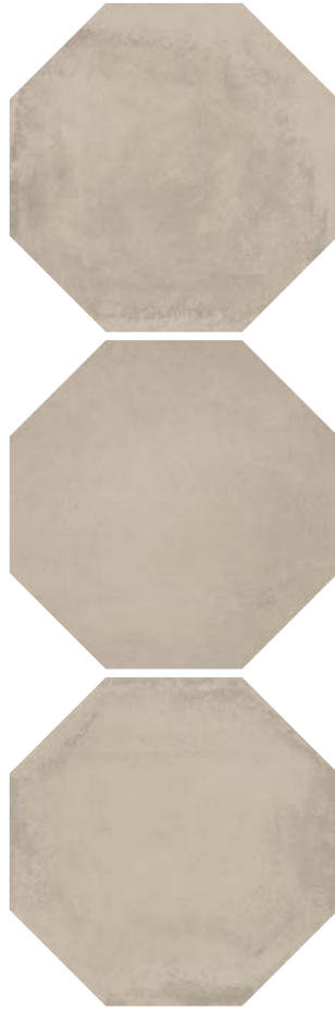
SG243200N Пьяцетта беж 24x24 Piazzetta beige