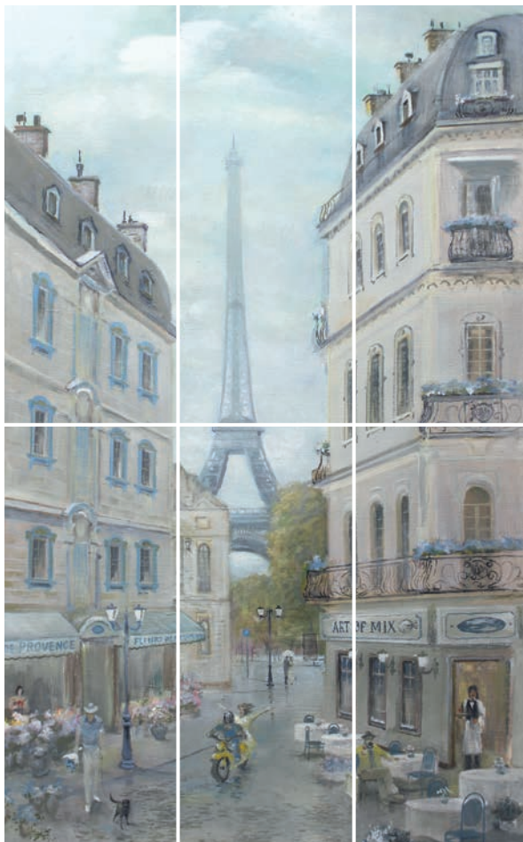
VB/A14/6x/7071 Кантри Шик Париж, панно из 6 частей 20x50 (размер каждой части) Country chic Paris, decorative panel