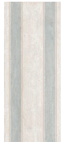
7187 Кантри Шик Полоски 20x50 Country chic Strips