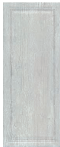
7192 Кантри Шик серый панель 20x50 Country chic grey panel