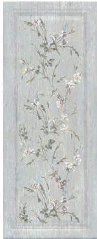
7189 Кантри Шик серый панель декорированный 20x50 Country chic grey panel decorated