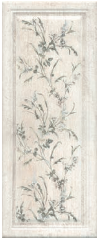
7188 Кантри Шик белый панель декорированный 20x50 Country chic white panel decorated