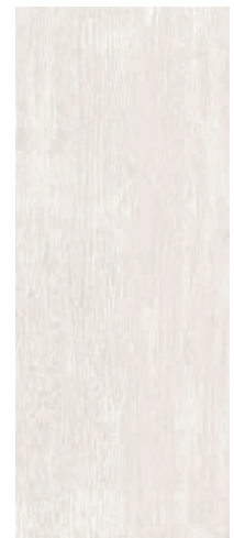
7186 Кантри Шик белый 20x50 Country chic white