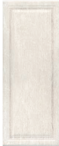
7191 Кантри Шик белый панель 20x50 Country chic white panel