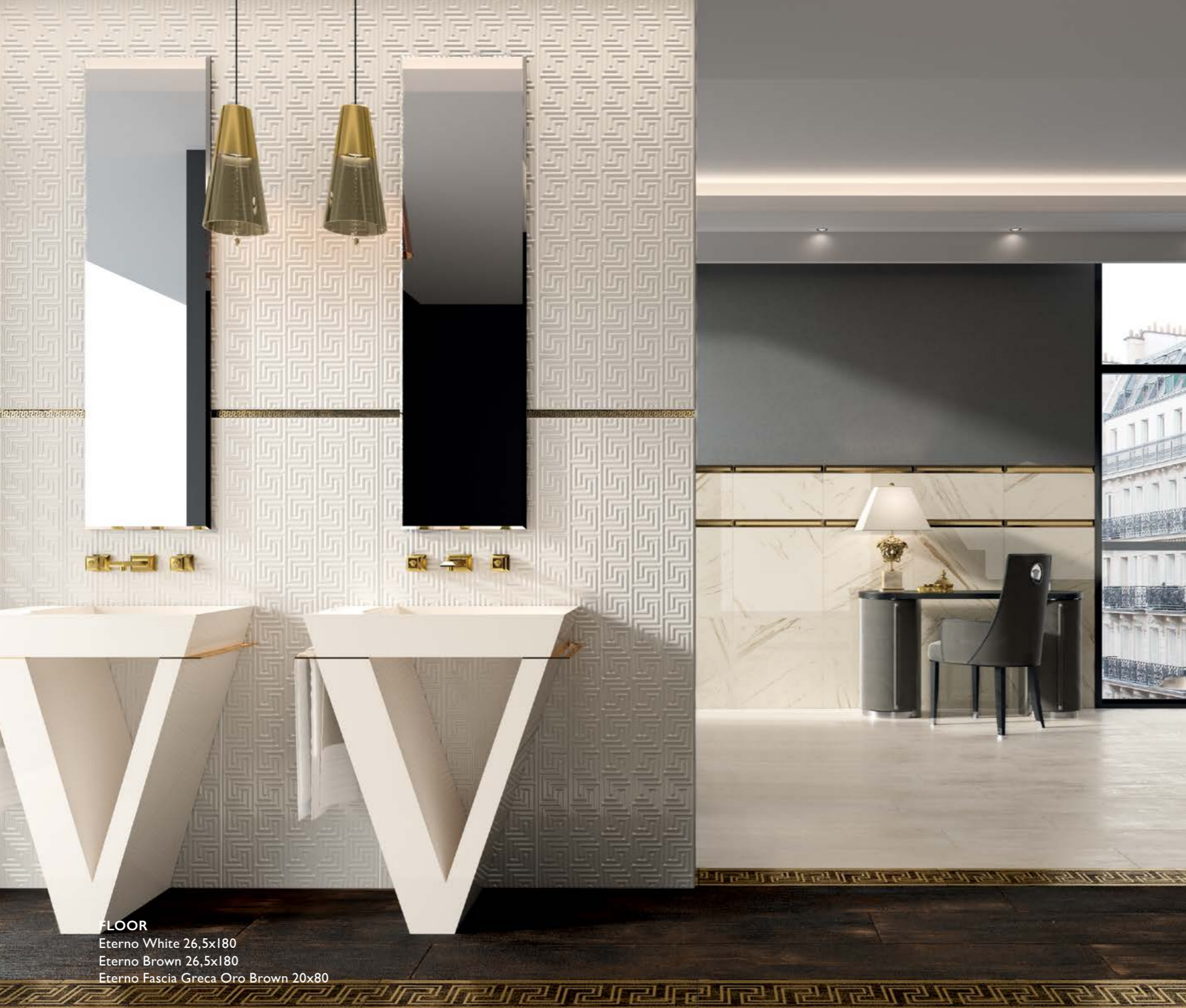
FLOOR Eterno White 26,5x180 Eterno Brown 26,5x180 Eterno Fascia Greca Oro Brown 20x80