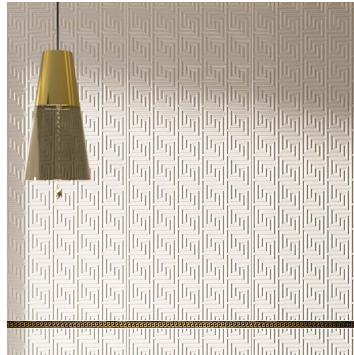
WALL Olympus Bianco 50x150 Solid Gold Listello Greca Black 2,5x60