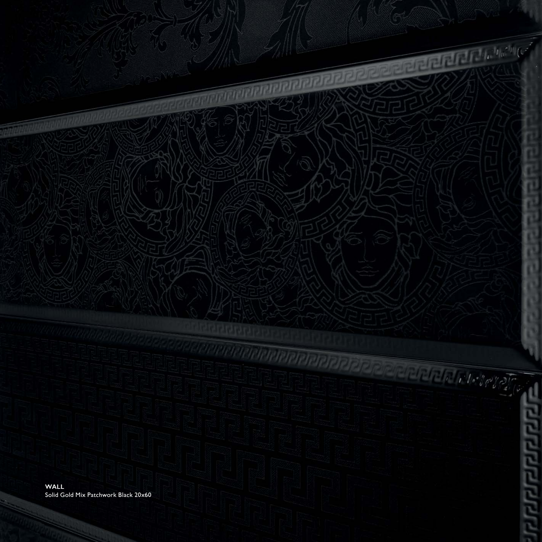
WALL Solid Gold Mix Patchwork Black 20x60