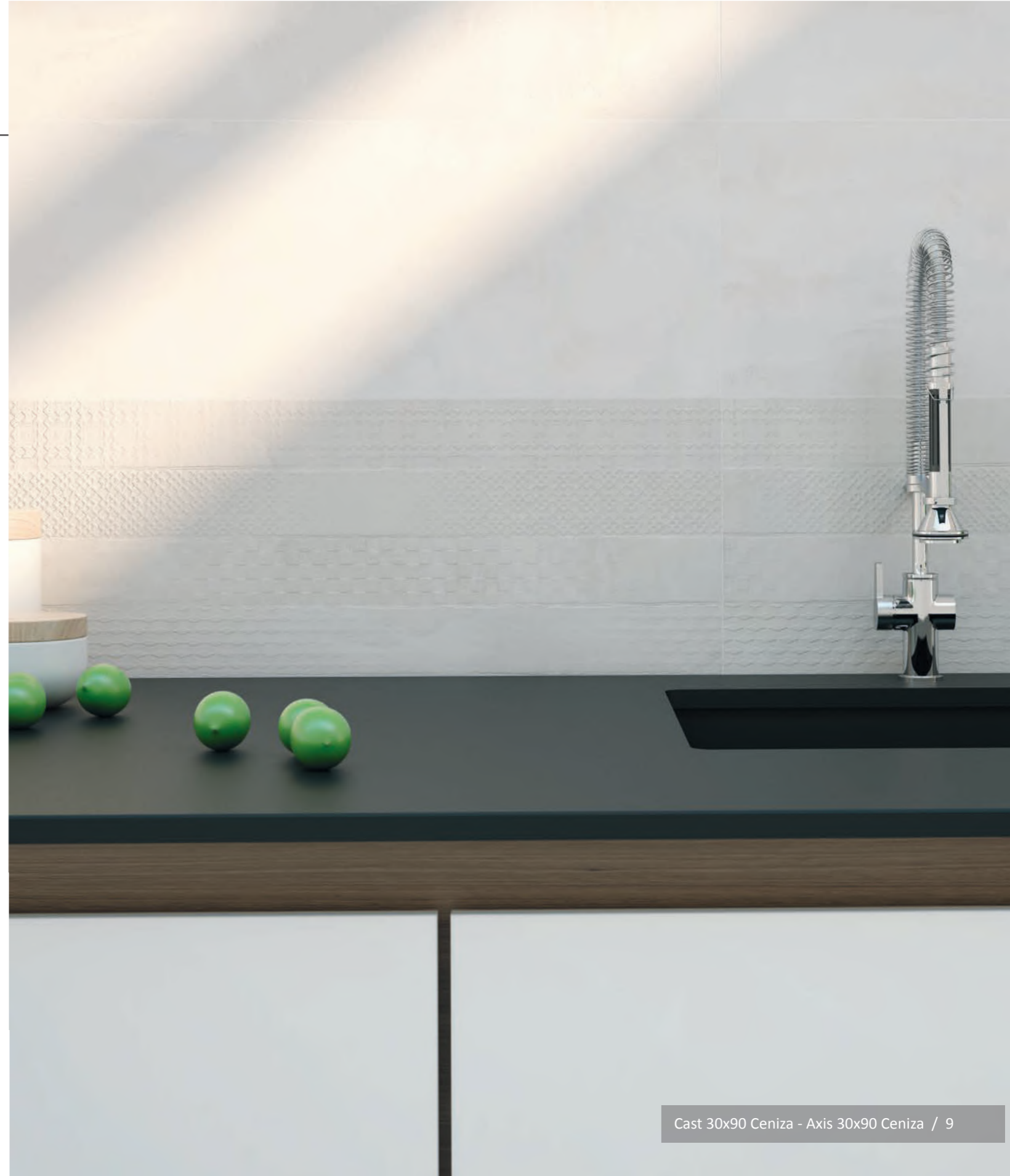
Cast 30x90 Ceniza - Axis 30x90 Ceniza / 9