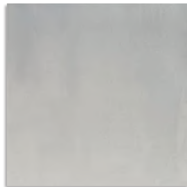
BYP710 Cast 60x60 Gris