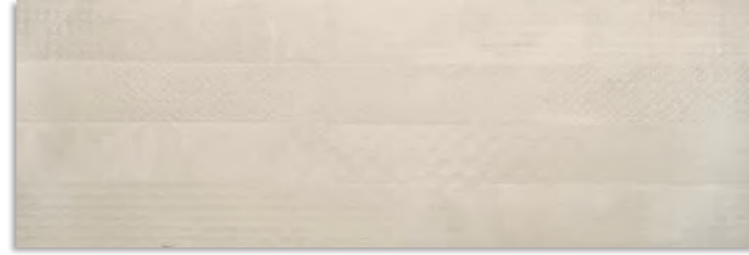
BWX620 Fuse 30x90 Crema