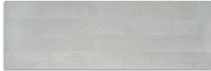
BWX710 Fuse 30x90 Gris