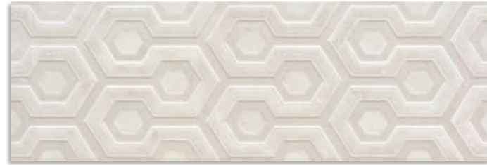
BTK713 Axis 30x90 Ceniza