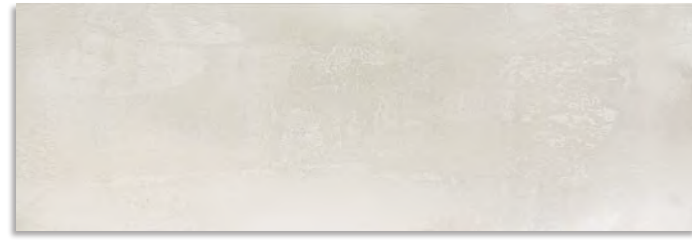
BXD713 Cast 30x90 Ceniza