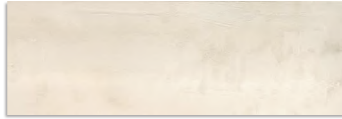
BXD670 Cast 30x90 Marfil