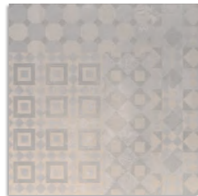
BVM990 Melt 60x60 Iris