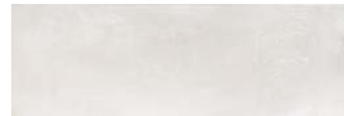
JAH713 CAST 30X90 CENIZA B27