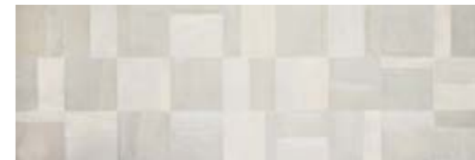
JBE990 M. CAST 30X90 IRIS B29