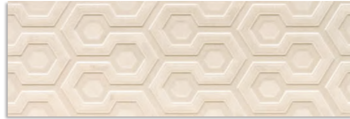
BTK670 Axis 30x90 Marfil