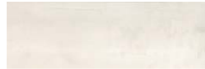
JAH670 CAST 30X90 MARFIL B27