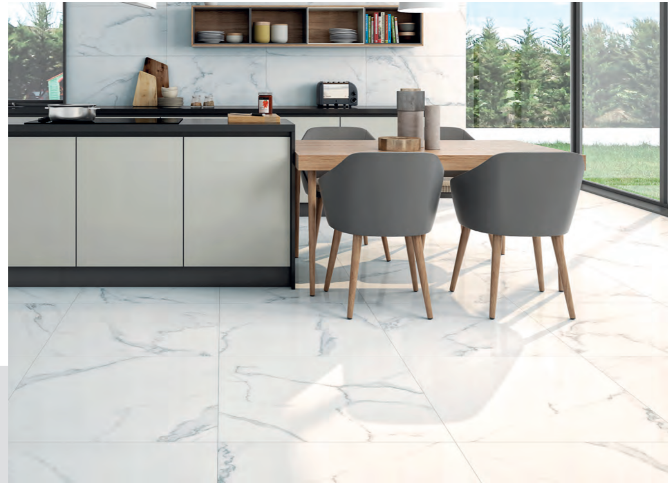
PVTO.: CALACATTA BLANCO 75x75