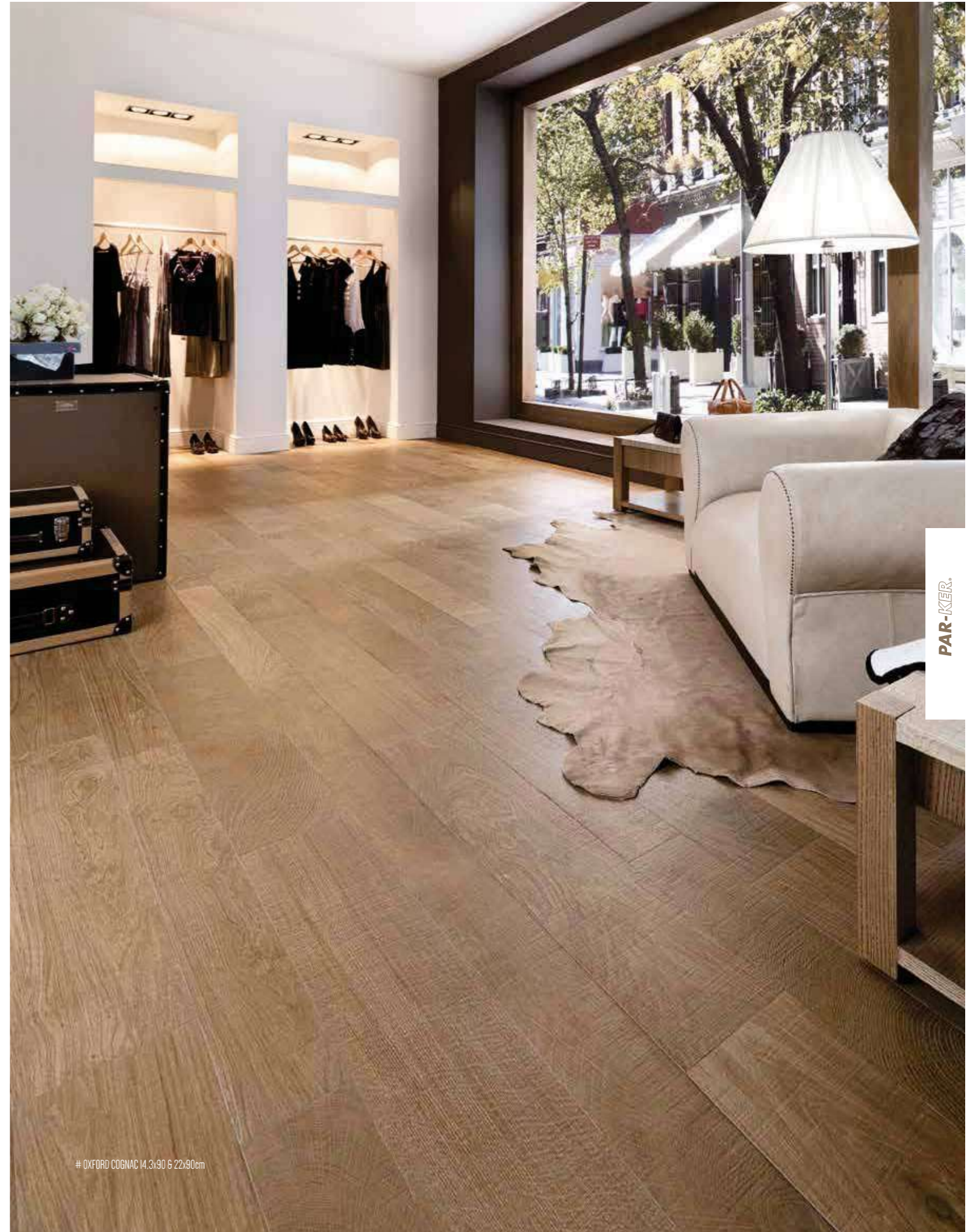
# OXFORD COGNAC 14,3x90 & 22x90cm