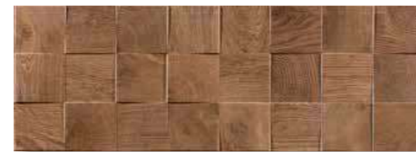
TACO OXFORD COGNAC 31,6x90x1,25cm P3470677 / 100135554 G271 Butech recomienda junta / Butech recommends joint: Colorstuk Rapid n Moka B21522220 / 100060549