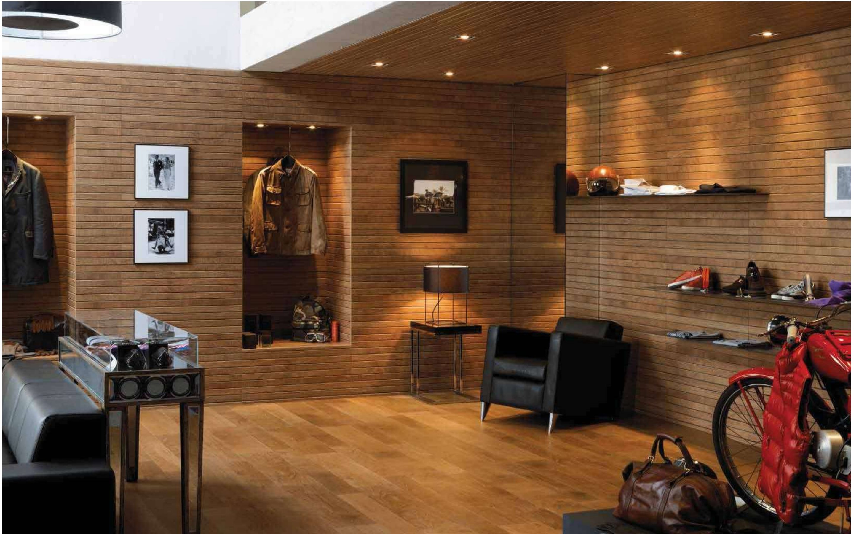
#LISTON OXFORD COGNAC 31,6x90cm