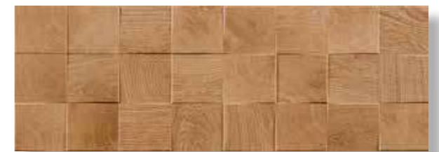
TACO OXFORD NATURAL 31,6x90x1,25cm P3470678 / 100135555 G271 Butech recomienda junta / Butech recommends joint: Colorstuk Rapid n Tabaco B22502011 / 100004304