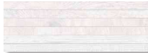
LISTON OXFORD BLANCO 31,6x90x1,1cm P3470671 / 100135533 G271 Butech recomienda junta / Butech recommends joint: Colorstuk Rapid n Gris B22502013 / 100004305