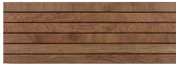
LISTON OXFORD COGNAC 31,6x90x1,1cm P3470662 / 100135534 G271 Butech recomienda junta / Butech recommends joint: Colorstuk Rapid n Moka B21522220 / 100060549