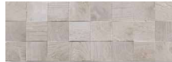
TACO OXFORD ACERO 31,6x90x1,25cm P3470661 / 100135552 G271 Butech recomienda junta / Butech recommends joint: Colorstuk Rapid n Cemento B22502004 / 100004297