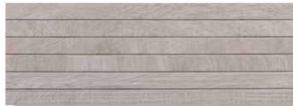
LISTON OXFORD ACERO 31,6x90x1,1cm P3470675 / 100135532 G271 Butech recomienda junta / Butech recommends joint: Colorstuk Rapid n Cemento B22502004 / 100004297