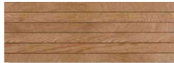
LISTON OXFORD NATURAL 31,6x90x1,1cm P3470657 / 100135535 G271 Butech recomienda junta / Butech recommends joint: Colorstuk Rapid n Tabaco B22502011 / 100004304