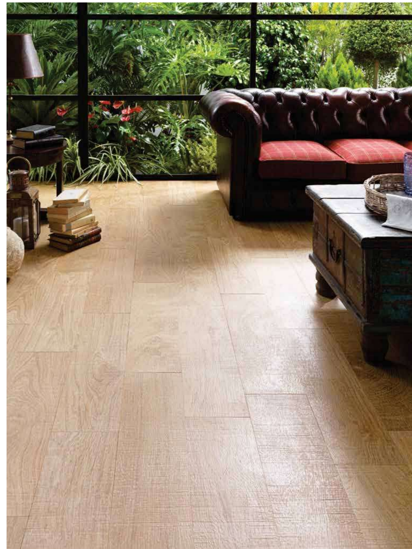
# LITTLE OXFORD NATURAL 21,5x65,9cm

LITTLE OXFORD NATURAL P-R G359 21,5x65,9x1,1cm P1350001 / 100173864 Butech recomienda junta / Butech recommends joint: Colorstuk Rapid n Tabaco B22502011 / 100004304