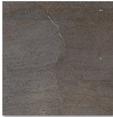
MILANO TOPO PUL. 58,6x58,6x1,03 cm P9210537 / 100214756 G370

Butech recomienda junta / Butech recommends joint: Colorstuk Especial n Nacaré B24302042 / 100090687