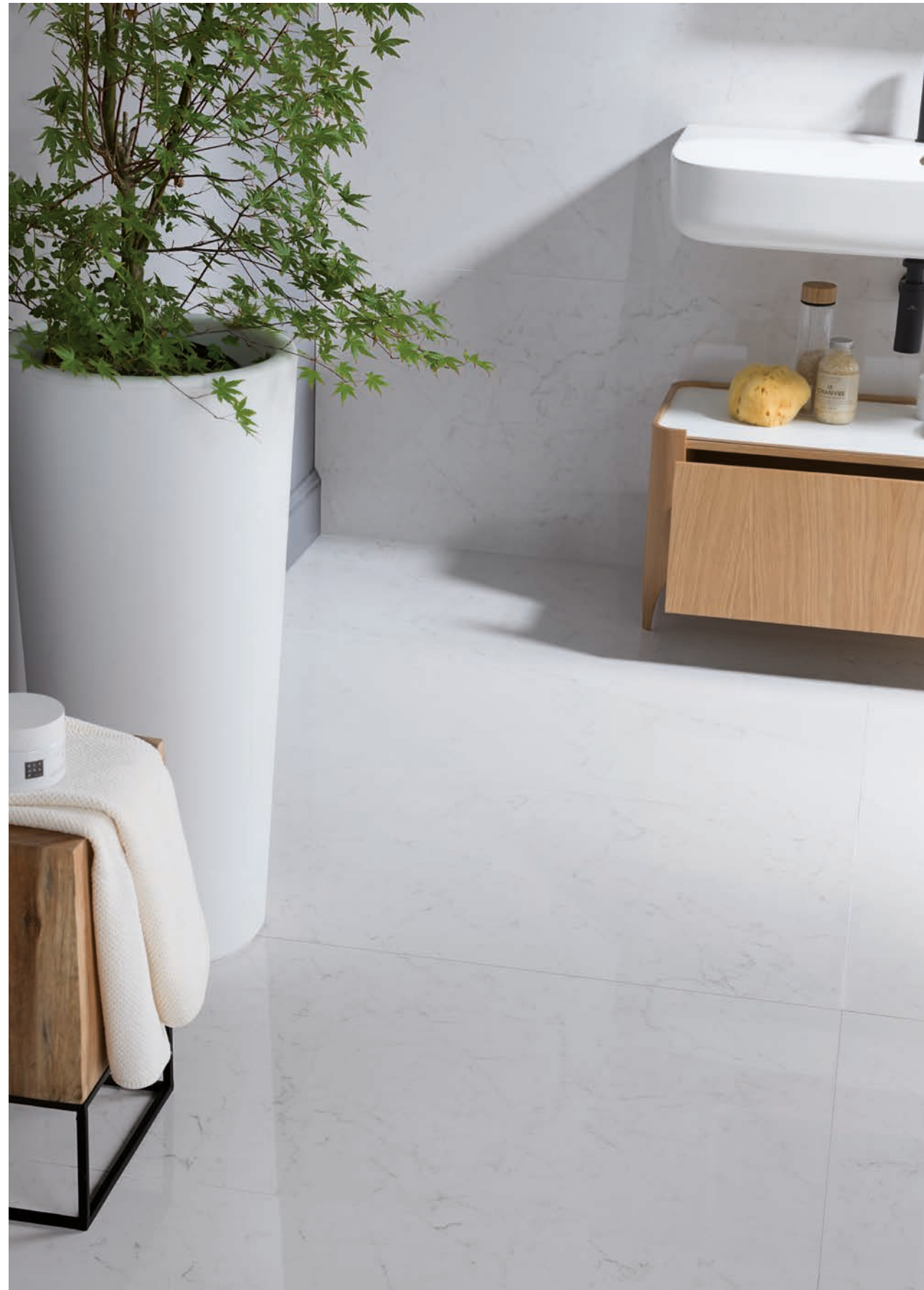
PAVIMENTO: BIANCO PULIDO 58,6x118,7cm