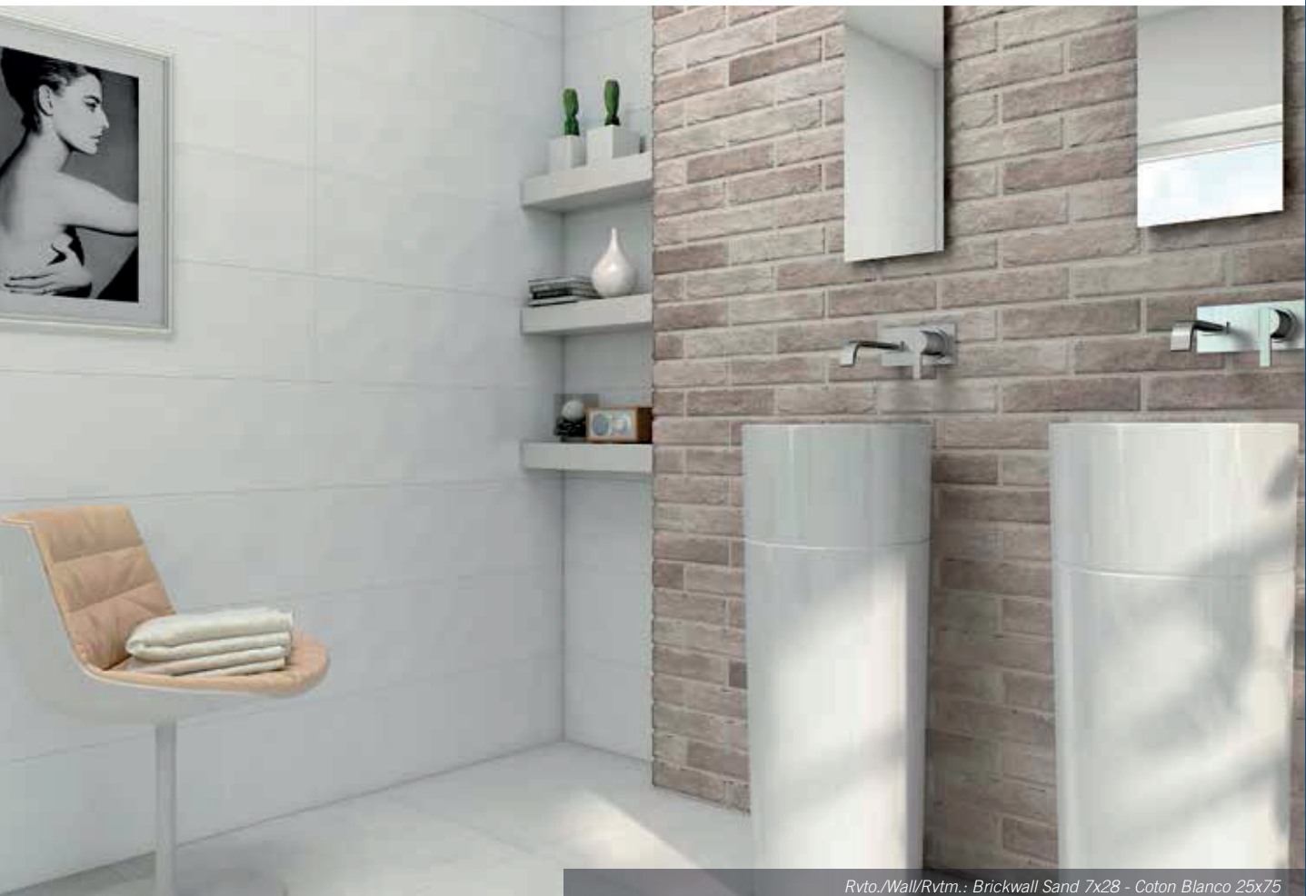
Rvto./Wall/Rvtm.: Brickwall Sand 7x28 - Coton Blanco 25x75 Pvto./Floor/Sol: Style Marfil Decorstone 60x60