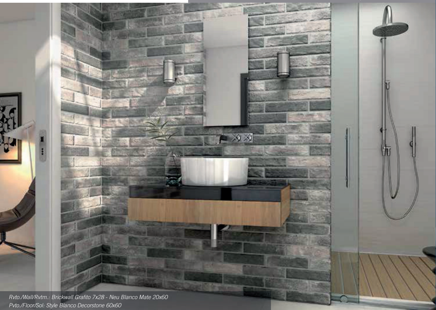
Rvto./Wall/Rvtm.: Brickwall Grafito 7x28 - Neu Blanco Mate 20x60 Pvto./Floor/Sol: Style Blanco Decorstone 60x60