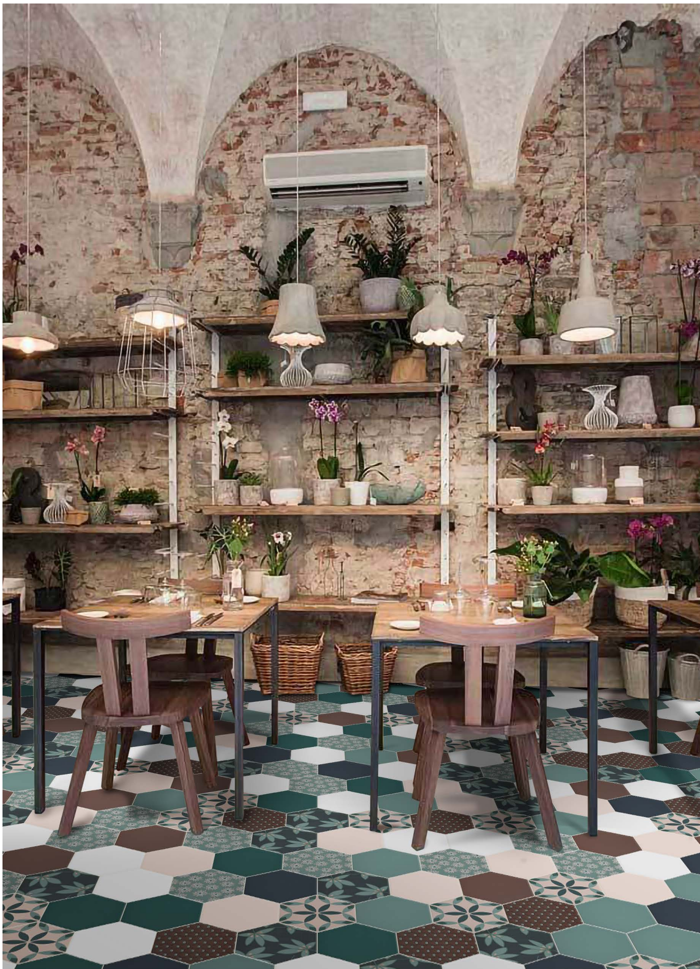
DE23R ROSE | DE23W WHITE | DE23BP BLUEPRINT | DE23DG DARK GREEN | DE23BR BROWN | DE23PB PEACOCK BLUE DE23PO POINTS | DE23PE PETAL | DE23CA CARPET | DE23DA DIAMOND | DE23SH SHELL | DE23GA GARDEN | Ø 23 | Ø 9"