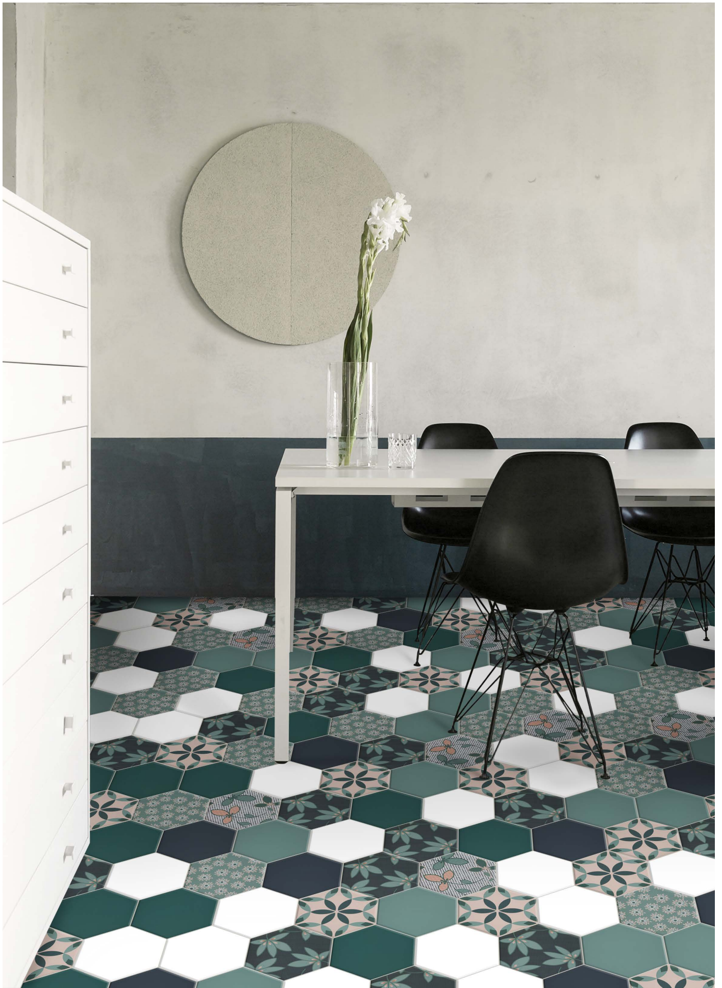
DE23W WHITE | DE23BP BLUEPRINT | DE23DG DARK GREEN | DE23PB PEACOCK BLUE | DE23PE PETAL | DE23CA CARPET | DE23GA GARDEN | Ø 23 | Ø 9"