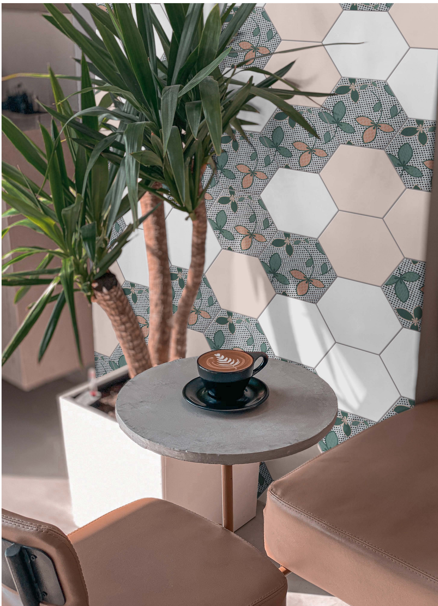
DE23W WHITE | DE23R ROSE | DE23PO POINTS | DE23CA CARPET | DE23PE PETAL | Ø 23 | Ø 9"