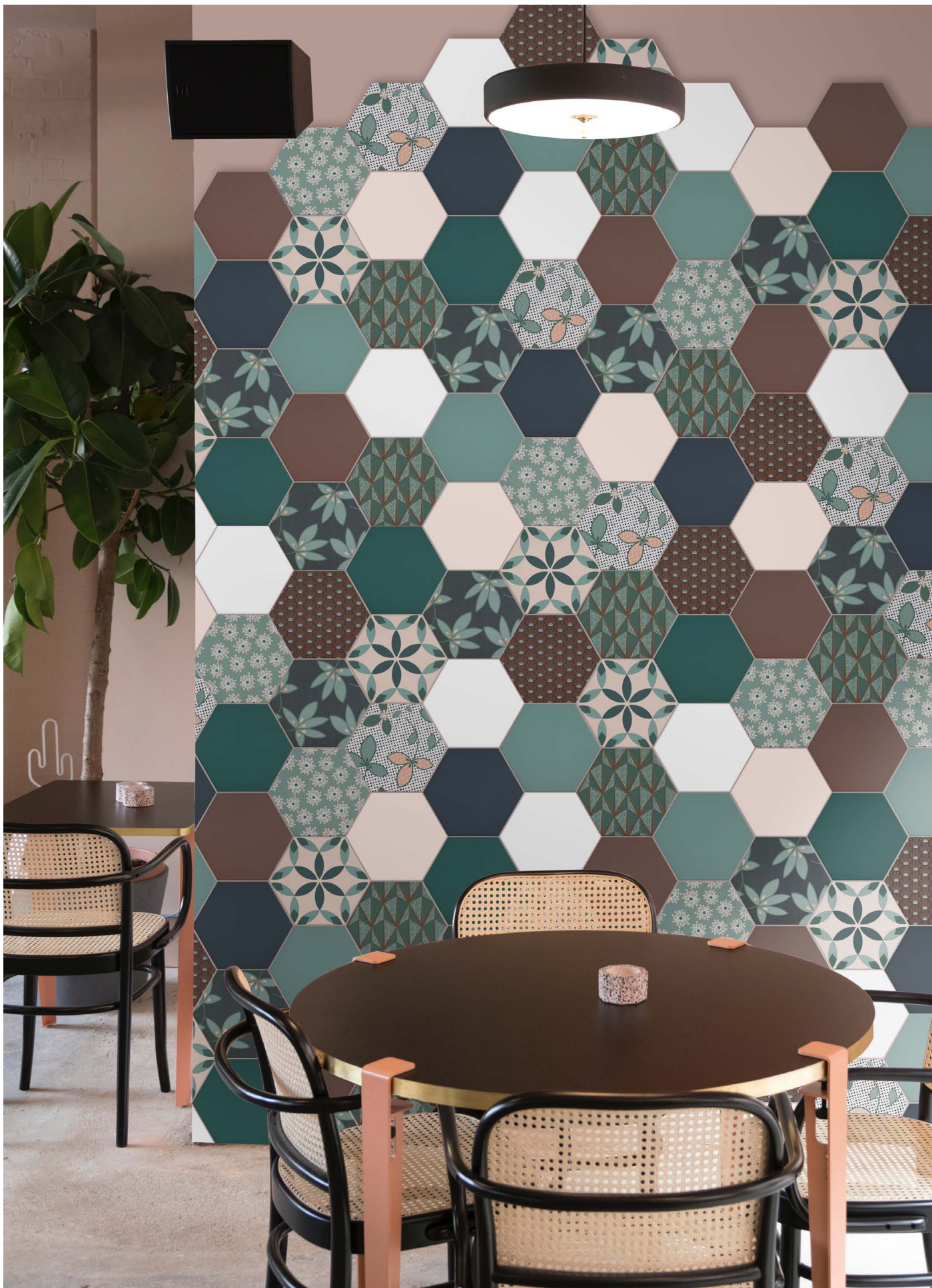
DE23R ROSE | DE23W WHITE | DE23BP BLUEPRINT | DE23DG DARK GREEN | DE23BR BROWN | DE23PB PEACOCK BLUE DE23PO POINTS | DE23PE PETAL | DE23CA CARPET | DE23DA DIAMOND | DE23SH SHELL | DE23GA GARDEN | Ø 23 | Ø 9"