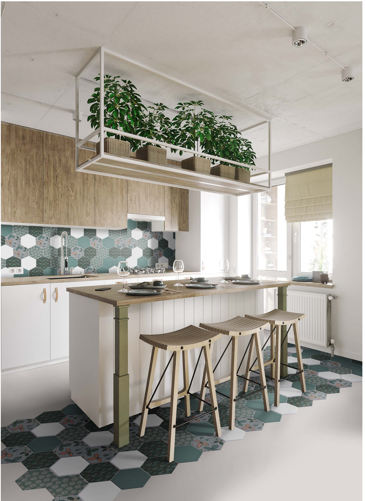
DE23W WHITE | DE23BP BLUEPRINT | DE23PO POINTS | DE23CA CARPET | DE23DA DIAMOND | Ø 23 | Ø 9"