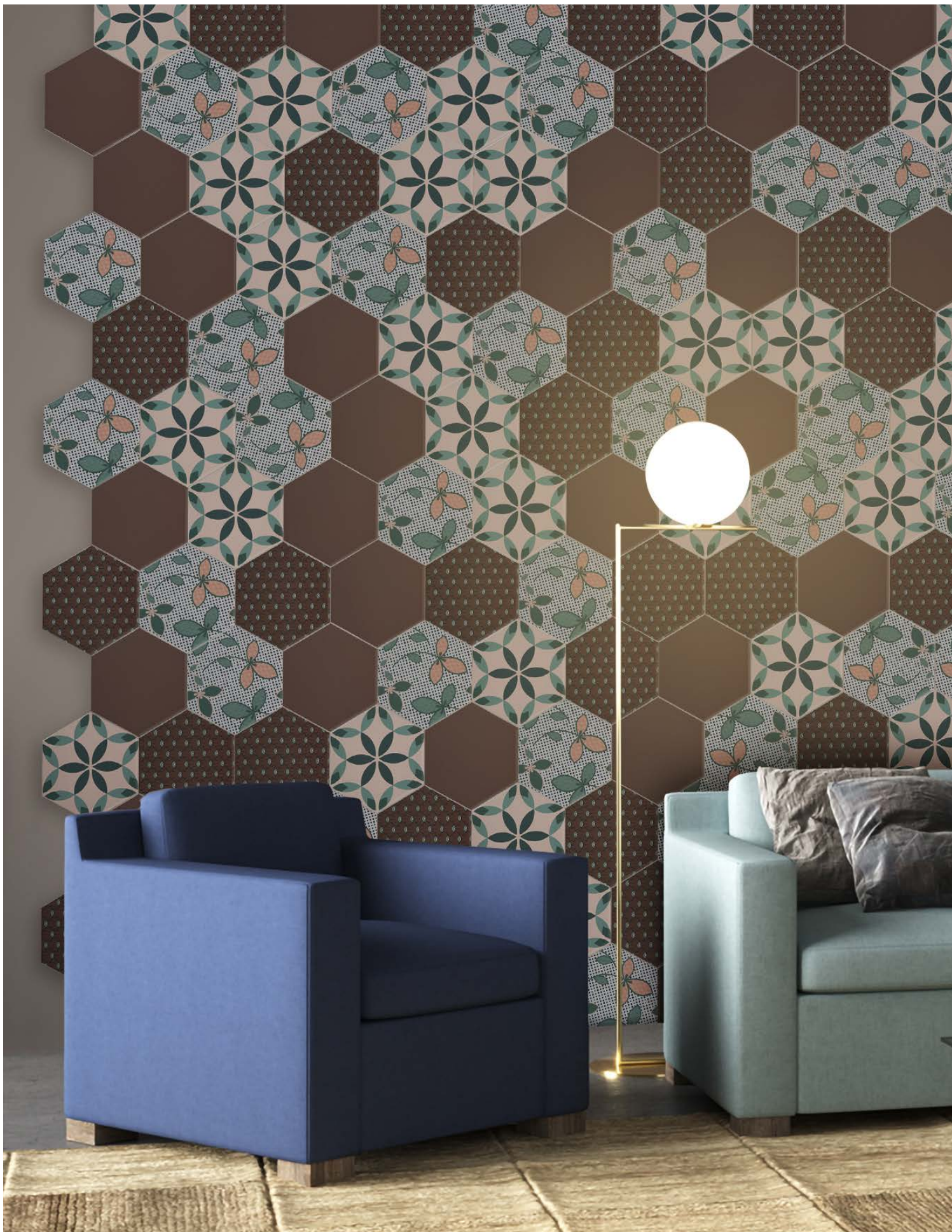
DE23BR BROWN | DE23POINTS | DE23PE PETAL | DE23SH SHELL | Ø 23 | Ø 9"