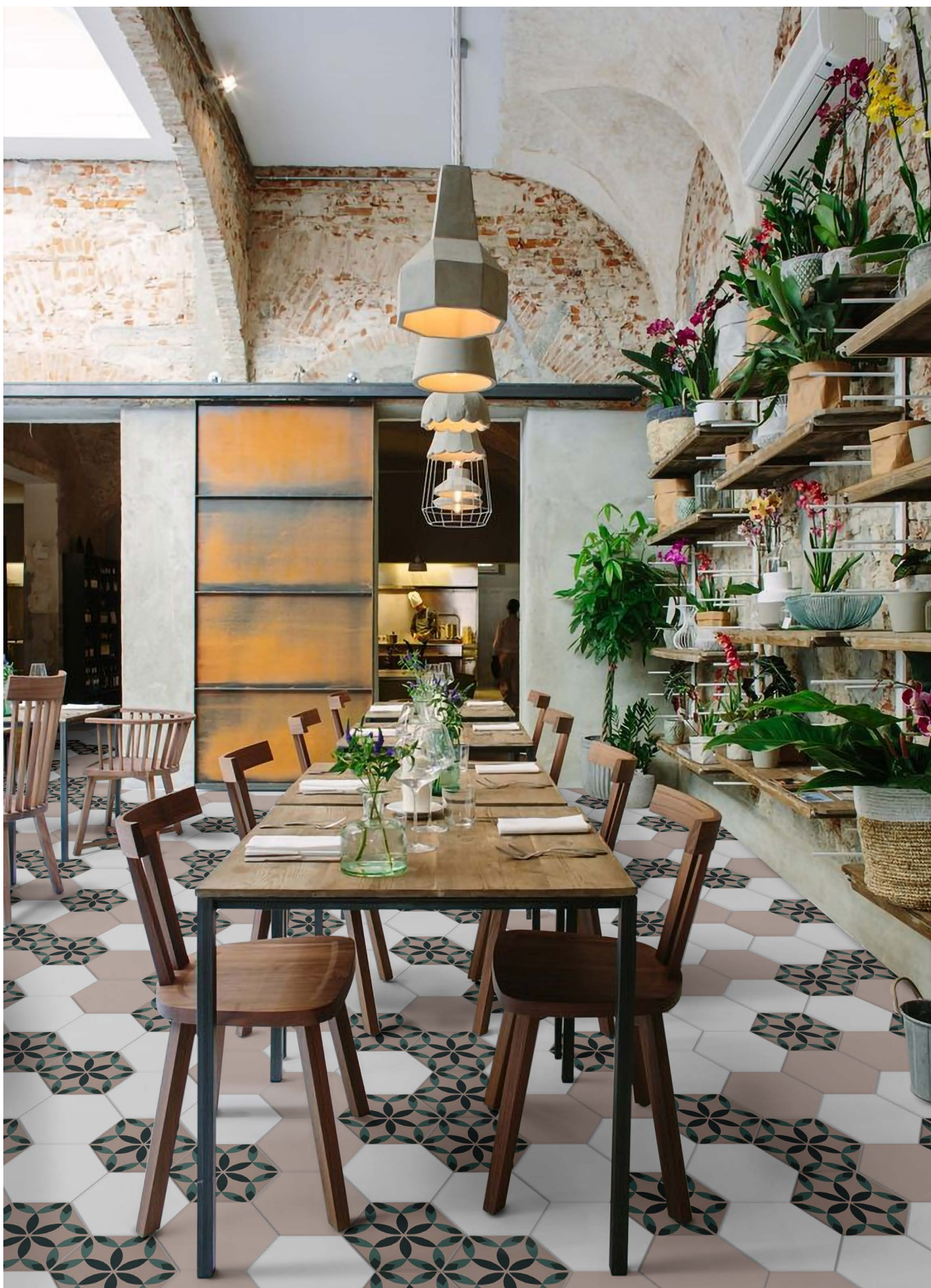
DE23R ROSE | DE23W WHITE | DE23PE PETAL | Ø 23 | Ø 9"