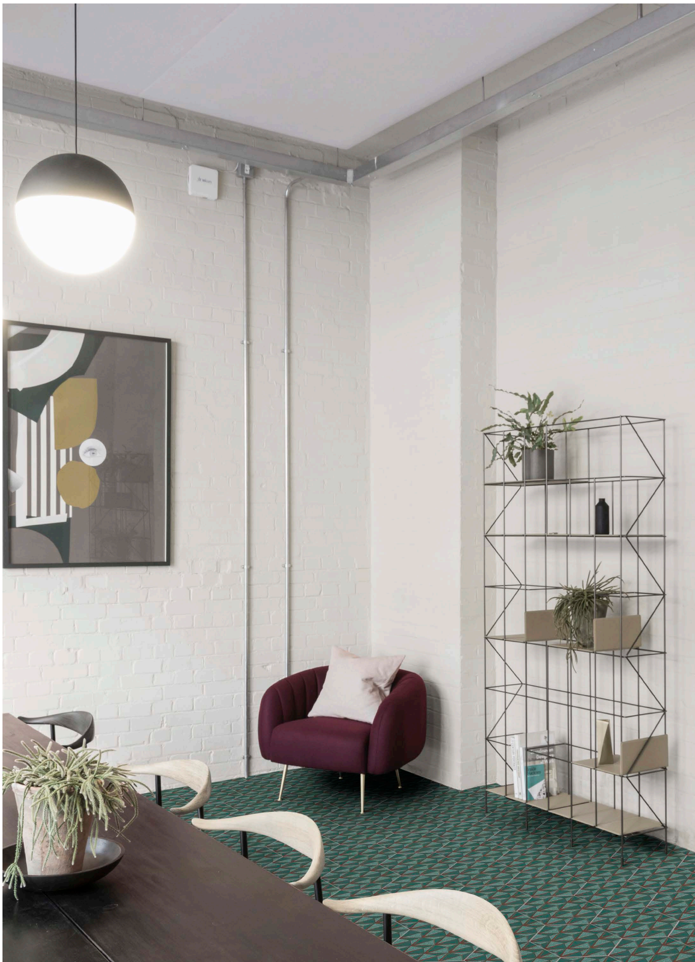
DE23DA DIAMOND | Ø 23 | Ø 9"