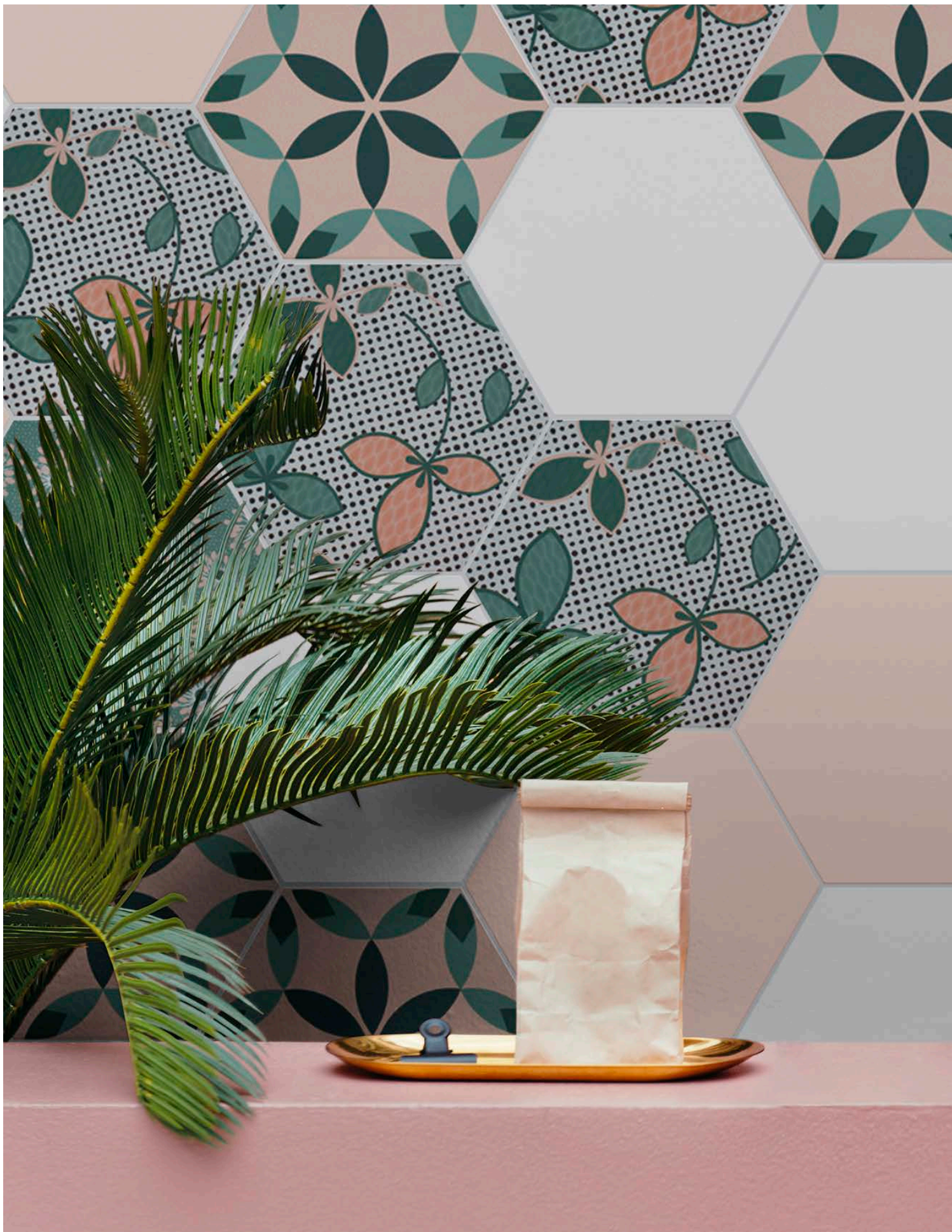
DE23W WHITE | DE23R ROSE | DE23PO POINTS | DE23PE PETAL | DE23CA CARPET | Ø 23 | Ø 9"A