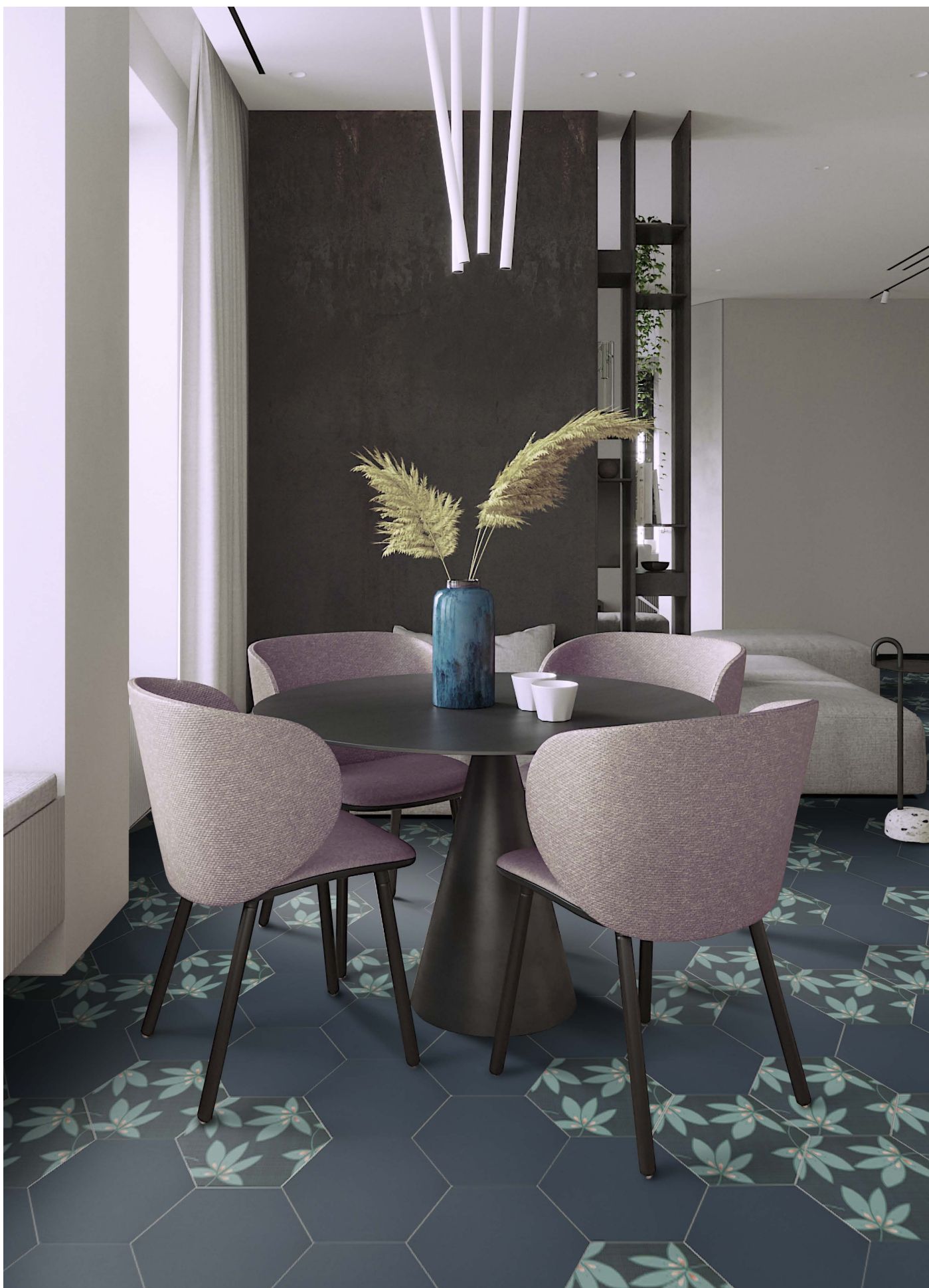
DE23PB PEACOCK BLUE | DE23GA GARDEN | Ø 23 | Ø 9"