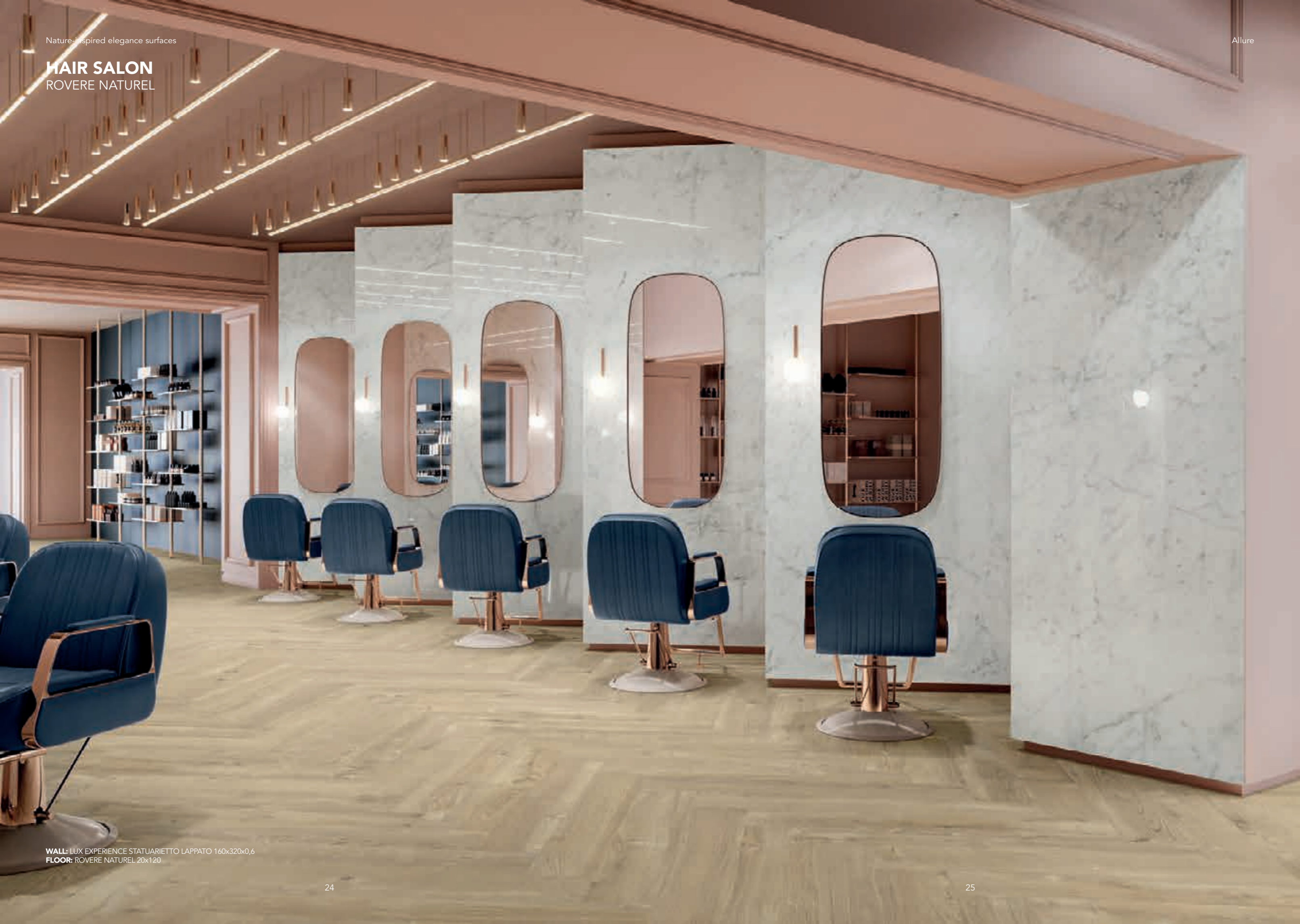
WALL: LUX EXPERIENCE STATUARIETTO LAPPATO 160x320x0,6 FLOOR: ROVERE NATUREL 20x120