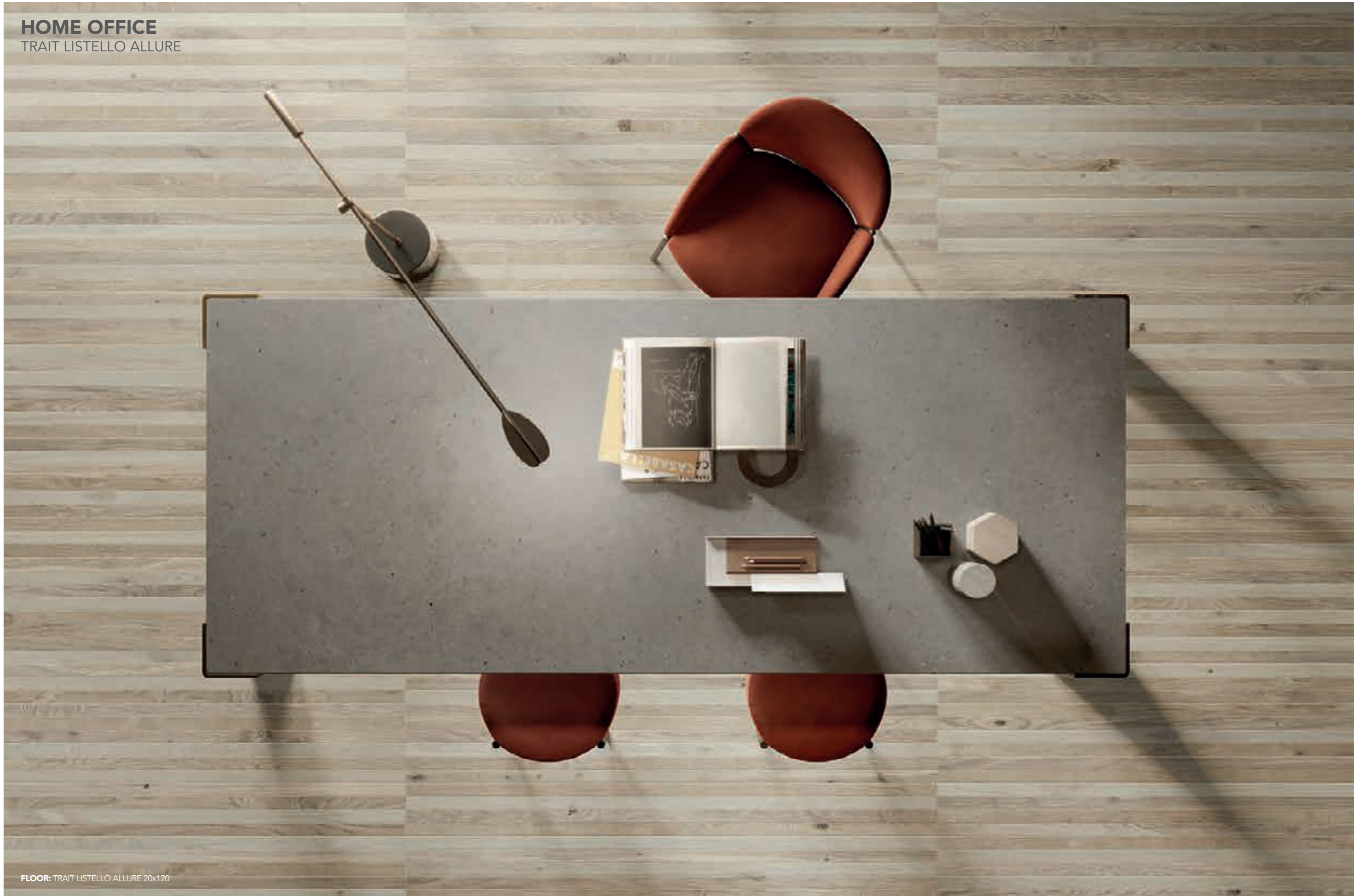
FLOOR: TRAIT LISTELLO ALLURE 20x120