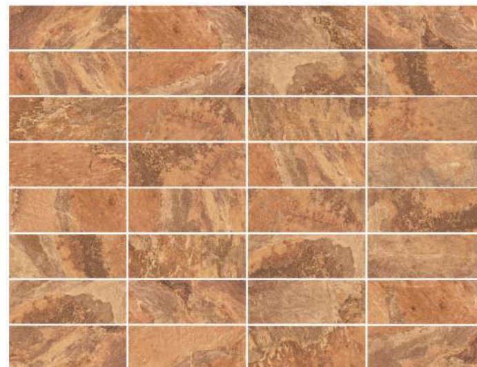
40 Different designs on 5 different reliefs