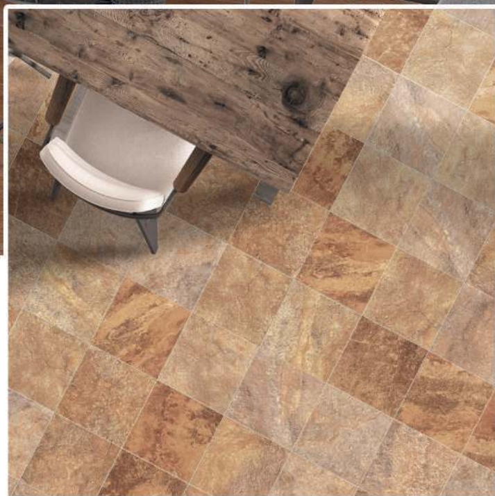
Floor Tile : Vermont Precut 45 x 45 cm (22,5 x 22,5 cm)