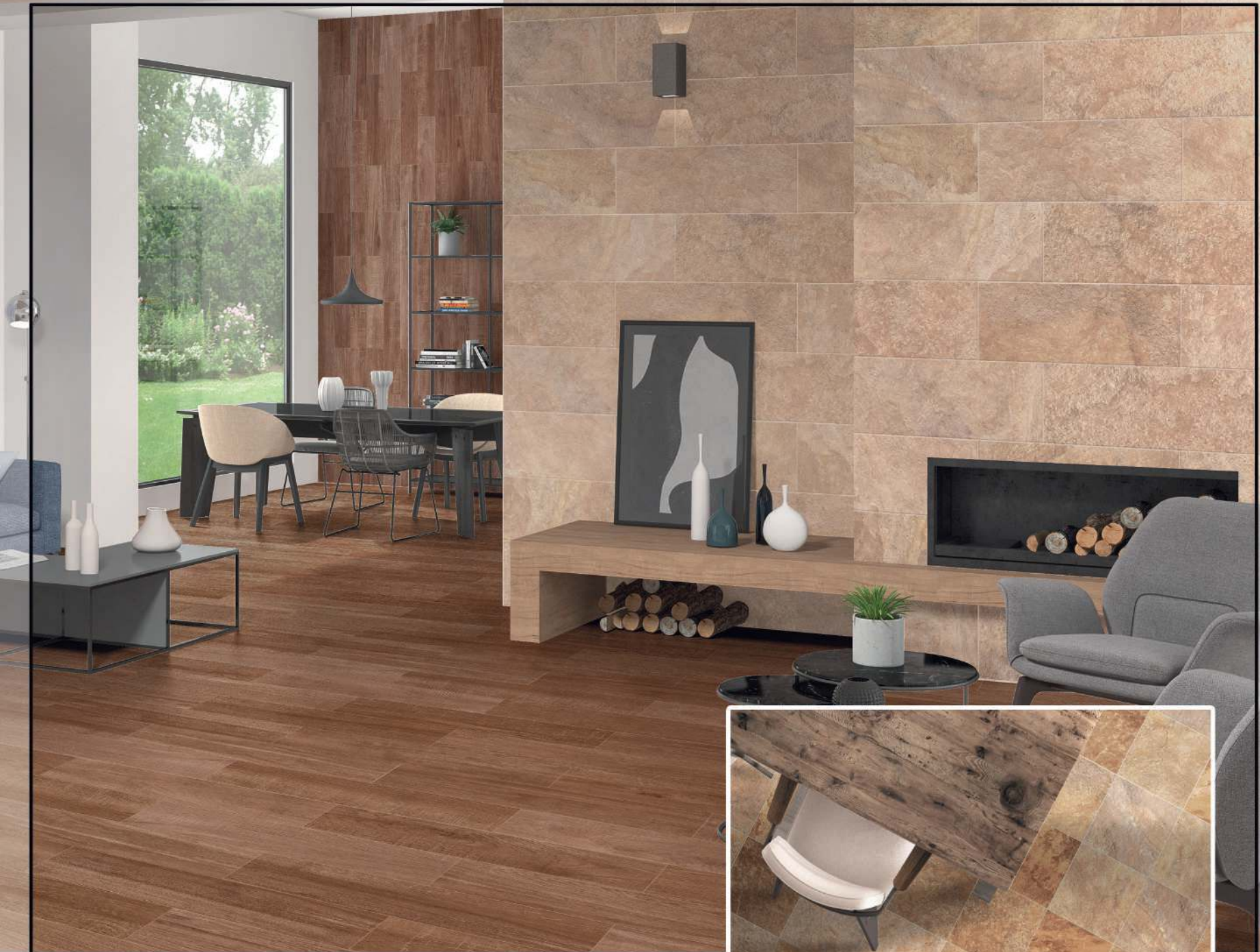
Wall Tile: Vermont Beige 21 x 56 cm & Wood essence wengué 10,5 x 56 cm Floor Tile: Wood essence wengué 10,5 x 56 cm