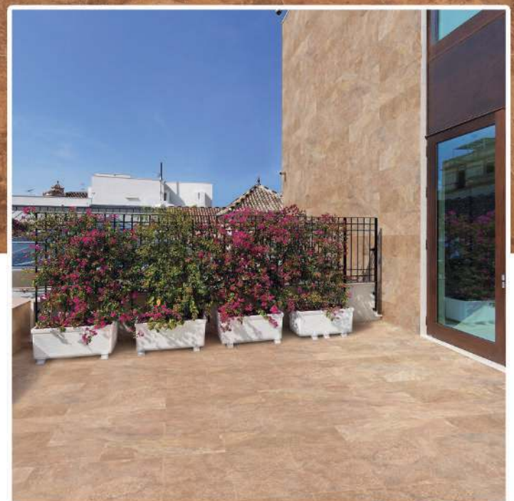
Wall Tile & Floor Tile : Vermont Beige 21 x 56 cm