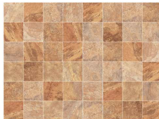
90 Different designs