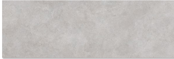
Base 25 x 75 217234 M55