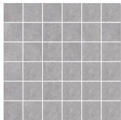
Mosaico 30 x 30 217395 M83