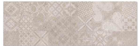
Patchwork 25 x 75 217238 M59