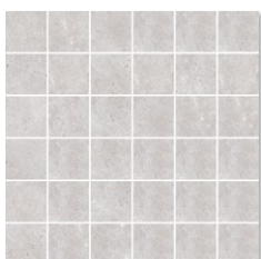
Mosaico 30x30 217396 M83