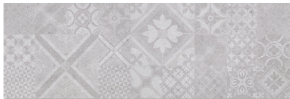
Patchwork 25 x 75 217237 M59