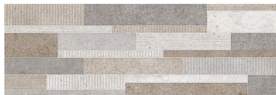
Surface 25x75 217363 M59