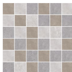
Mos. MIX 30x30 217397 M83