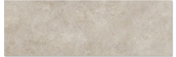
Base 25 x 75 217235 M55