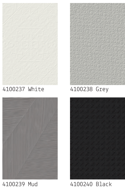
4100237 White 4100238 Grey 4100239 Mud 4100240 Black

TECHNOLOGY PORCELLANATO ESTRUSO A TUTTA MASSA - FULL BODY EXTRUDED PORCELAIN FINISH OPACO - NATURAL - 6 PATTERNS RANDOMLY MIXED FEATURES TONI E CALIBRI DIFFERENTI SONO CARATTERISTICHE INTRINSECHE DEL PRODOTTO SLIGHT SHADE AND CALIBER VARIATIONS ARE AN INTRINSIC PROPERTY OF THIS ARTISAN PORCELAIN THICKNESS 8 MM