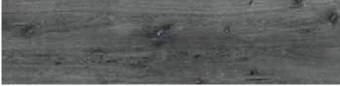
FOREST DARK 758058 30x120 (11 3/16 "x47 1/8 ")