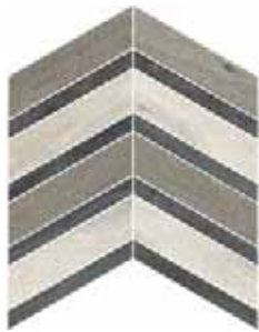
DECORO 2 A 758375 30x30 (11 3/4 "x11 3/4 ") White/Ash/Dark