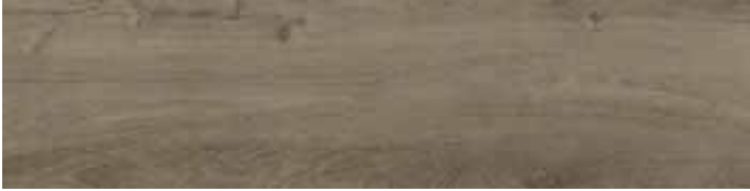
FOREST NATURAL 758055 30x120 (11 3/8 "x47 1/8 "