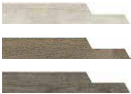
DECORO 1 B 758374 10x60 (4"x23 5/8 ") White/Natural/Brown 12 PZ/BOX

schemi di posa / laying scheme / schéma de pose Verlegungsschemen / esquema de colocación / схема укладки