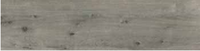
FOREST ASH 758057 30x120 (11 3/4 "x47 1/8 ")