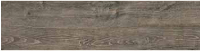
FOREST BROWN 758056 30x120 (11 3/16 "x47 1/8 ")