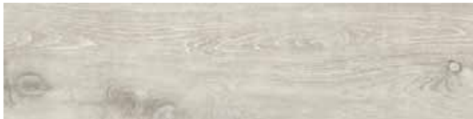
FOREST WHITE 758054 30x120 (11 3/16 "x47 1/8 ")