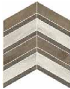
DECORO 2 B 758376 30x30 (11 3/4 "x11 3/4 ") White/Natural/Brown