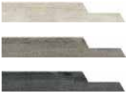
DECORO 1 A 758373 10x60 (4"x23 5/8 ") White/Ash/Dark 12 PZ/BOX