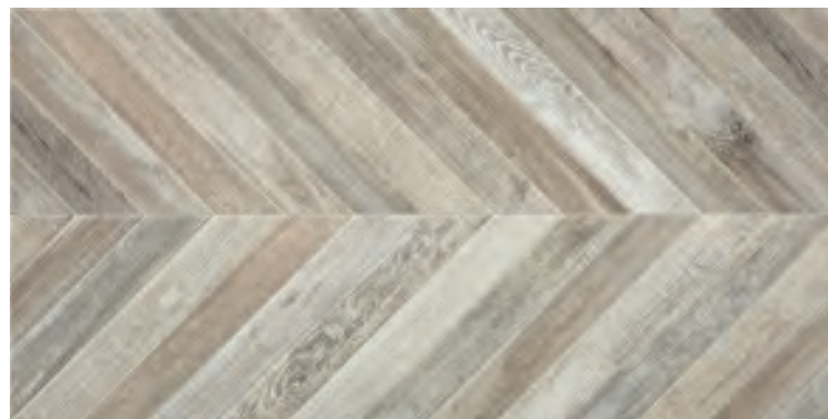
ALTAIR Gris 50x100 · 19,7" x 39,3" PP1502