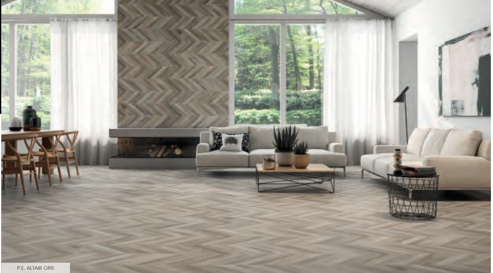
P.E. ALTAIR GRIS