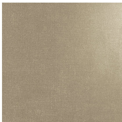
ELAN TAUPE F4545L