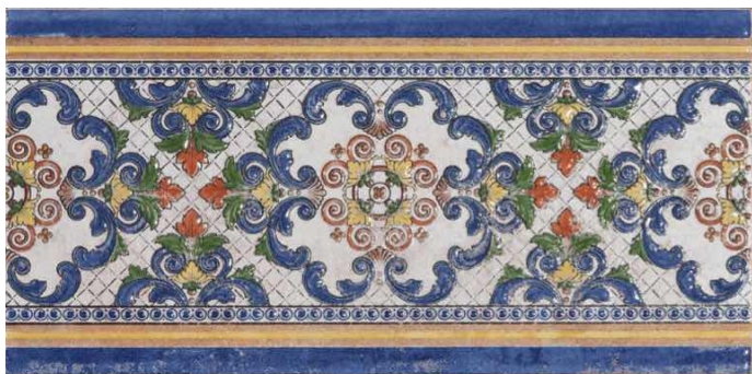
CENEFA CRETAS | Catálogo 16.5x33.3