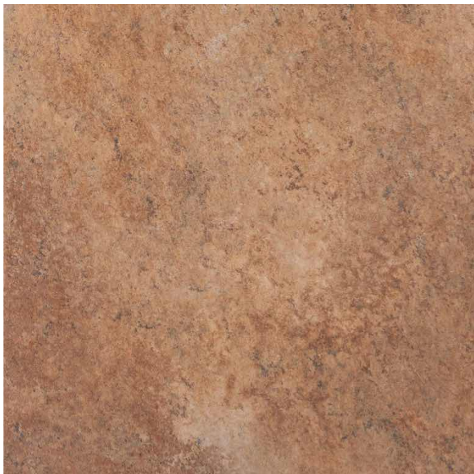
CRETAS BARRO | Catálogo 33.3x33.3