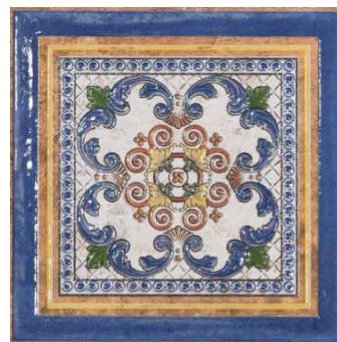
TACO CRETAS | Catálogo 16.5x16.5