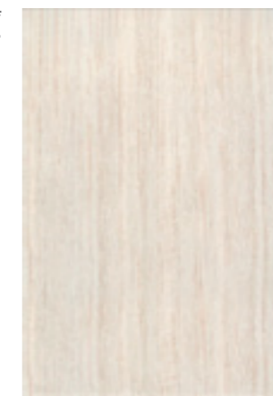
Оригами Латте / 278x405 мм

* декоративные элементы выполнены с использованием платины