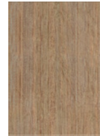
Оригами Табакко / 278x405 мм