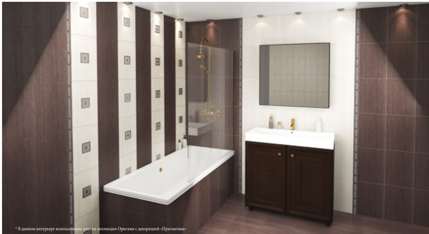
* В данном интерьере использованы плитки коллекции Оригами с декорацией «Прагматика»