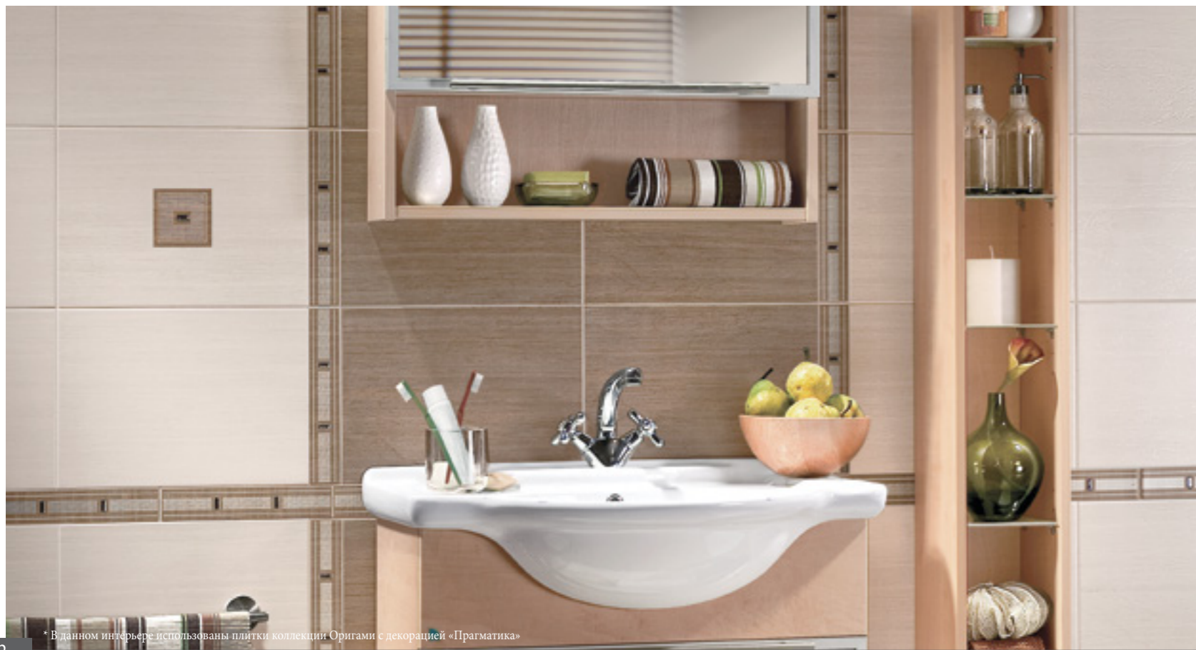
* В данном интерьере использованы плитки коллекции Оригами с декорацией «Прагматика»