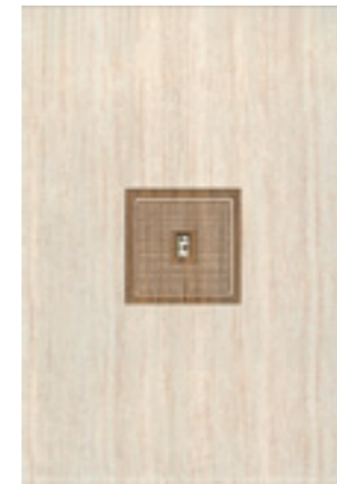
Декор Оригами Табакко «Прагматика» / 278x405 мм

* декоративные элементы выполнены с использованием платины