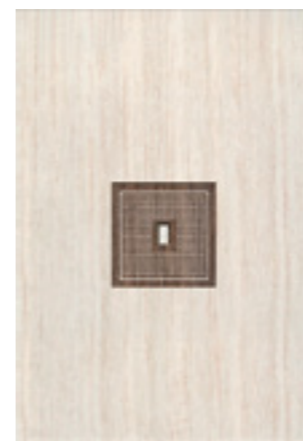
Декор Оригами Мокка «Прагматика» / 278x405 мм

* декоративные элементы выполнены с использованием платины