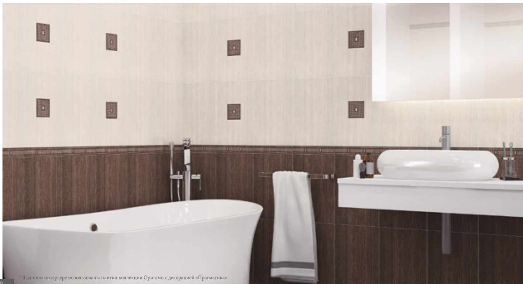
* В данном интерьере использованы плитки коллекции Оригами с декорацией «Прагматика»