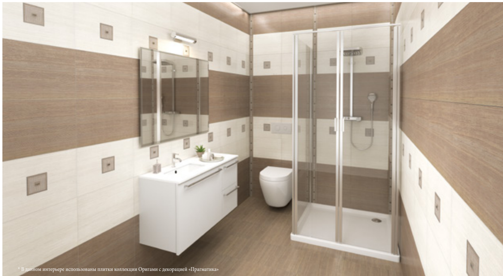
* В данном интерьере использованы плитки коллекции Оригами с декорацией «Прагматика»