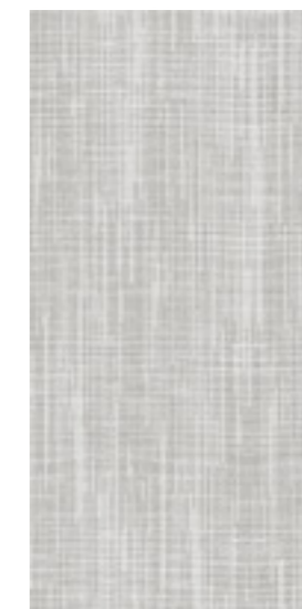
Evora Fiber / 315x630 mm