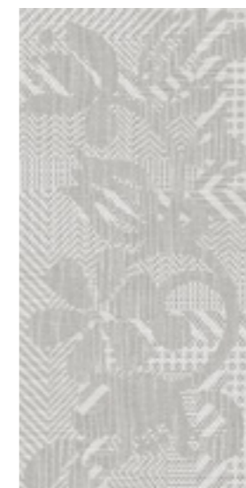
Evora «Flower» / 315x630 mm