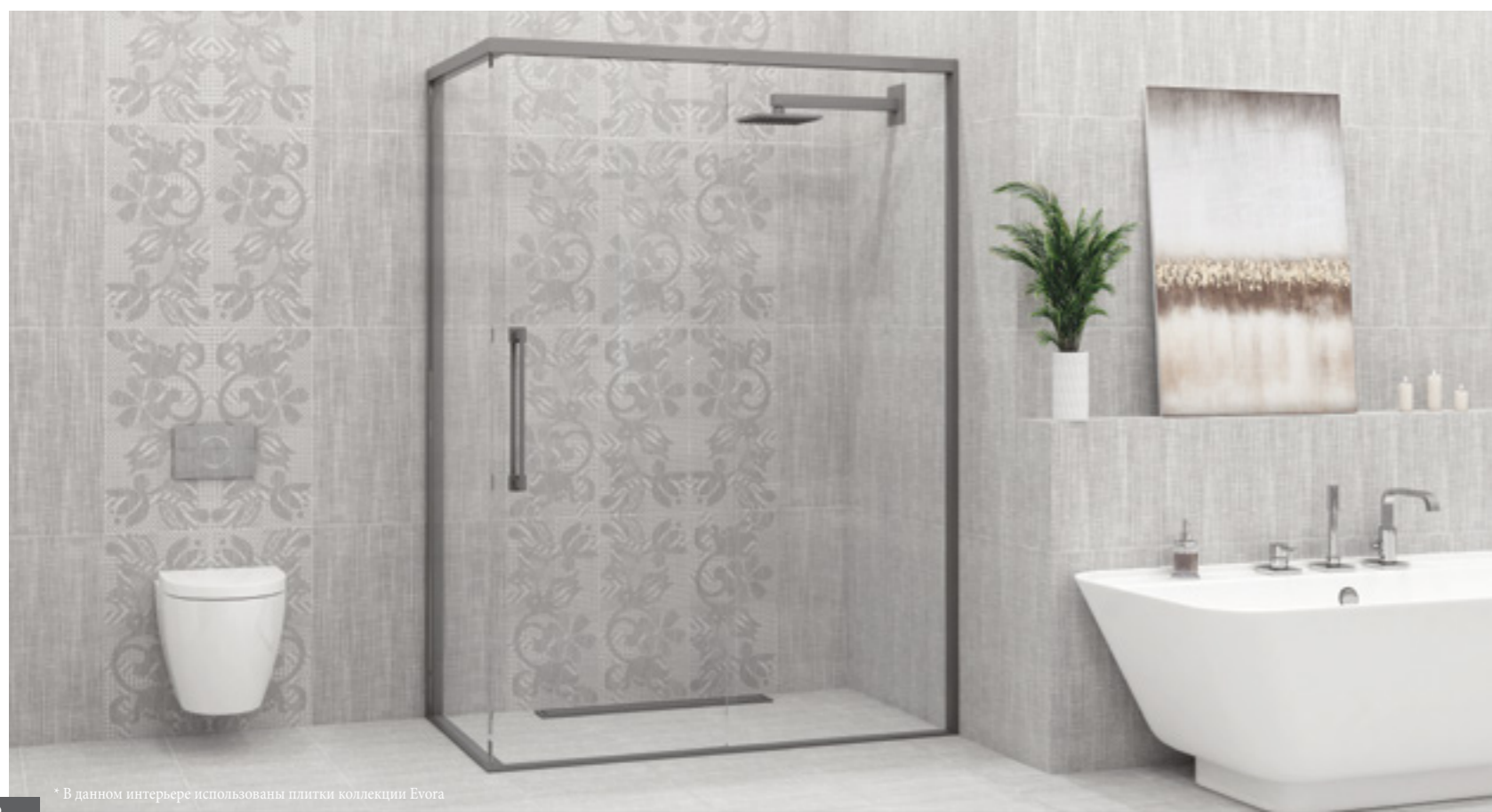
* В данном интерьере использованы плитки коллекции Evora