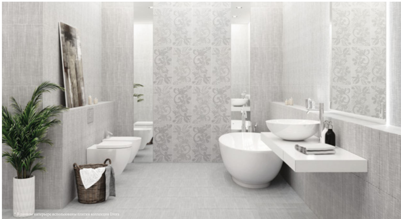
* В данном интерьере использованы плитки коллекции Evora