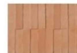
DAWN MD 03 Terracotta