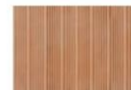
ARMOR MD 03 Terracotta