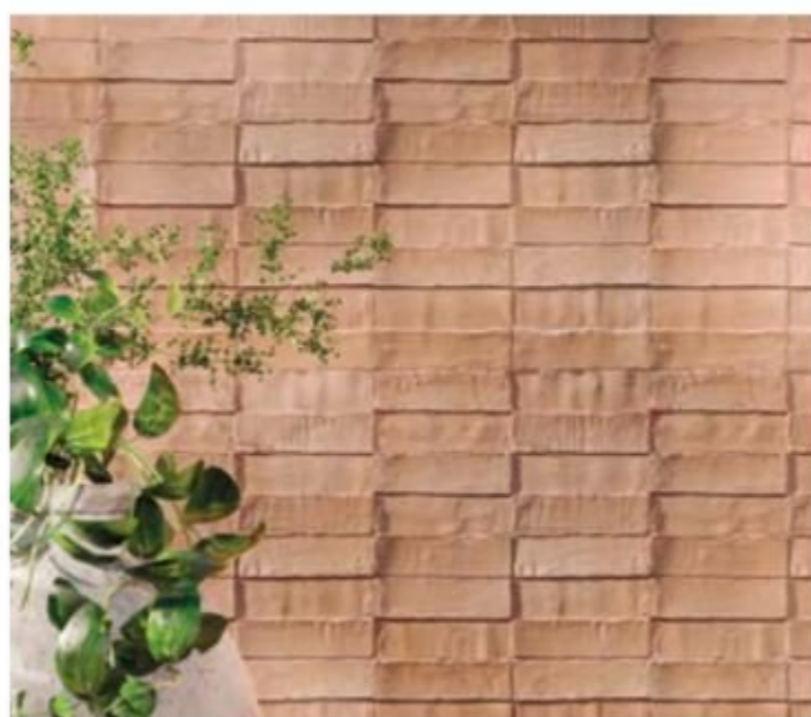
Wall Dawn MD 03 Terracotta NO SQ 300x450 / 12"x18"