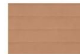
MELLOW MD 03 Terracotta