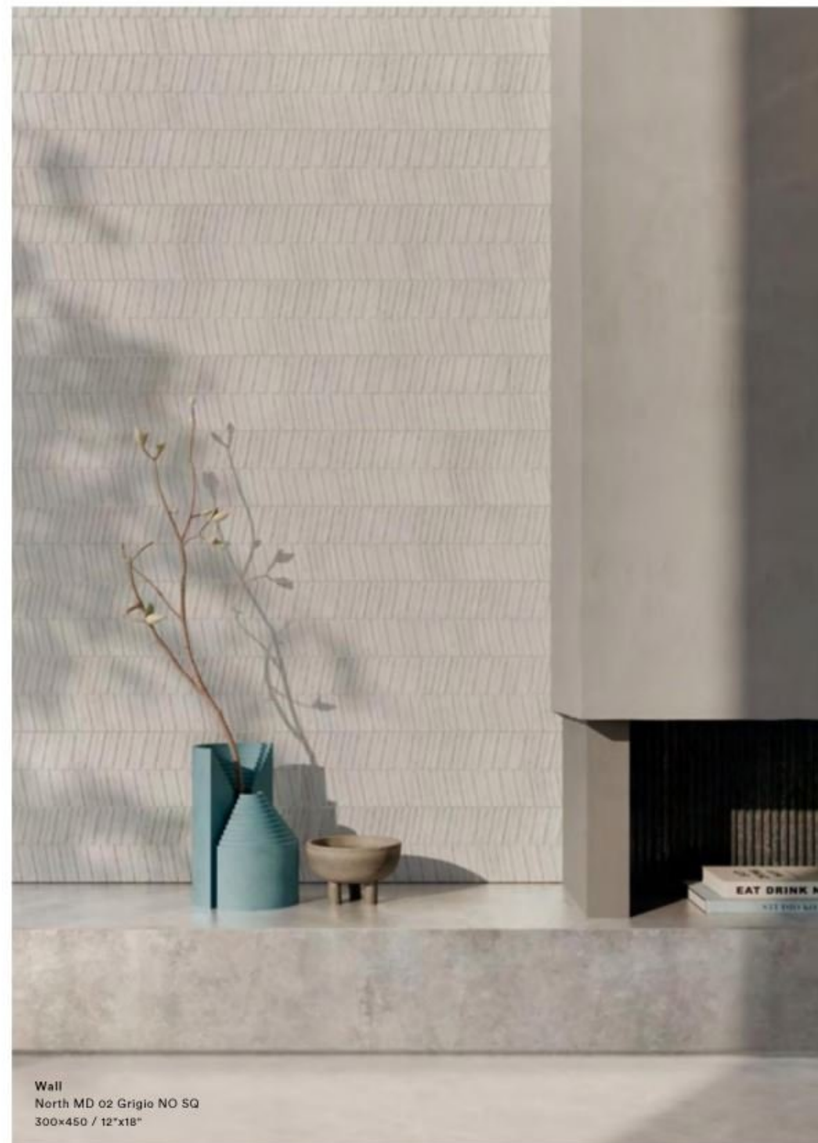
Wall North MD 02 Grigio NO SQ 300x450 / 12"x18"

The different structures characterise and cover the environments according to the refractions of light and in relation to the installation, conferring a multitude of expressions and a strong sense of textural depth.