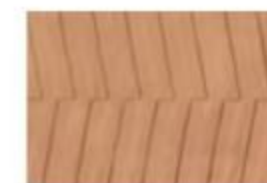
NORTH MD 03 Terracotta