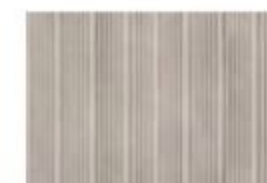
ARMOR MD 02 Grigio