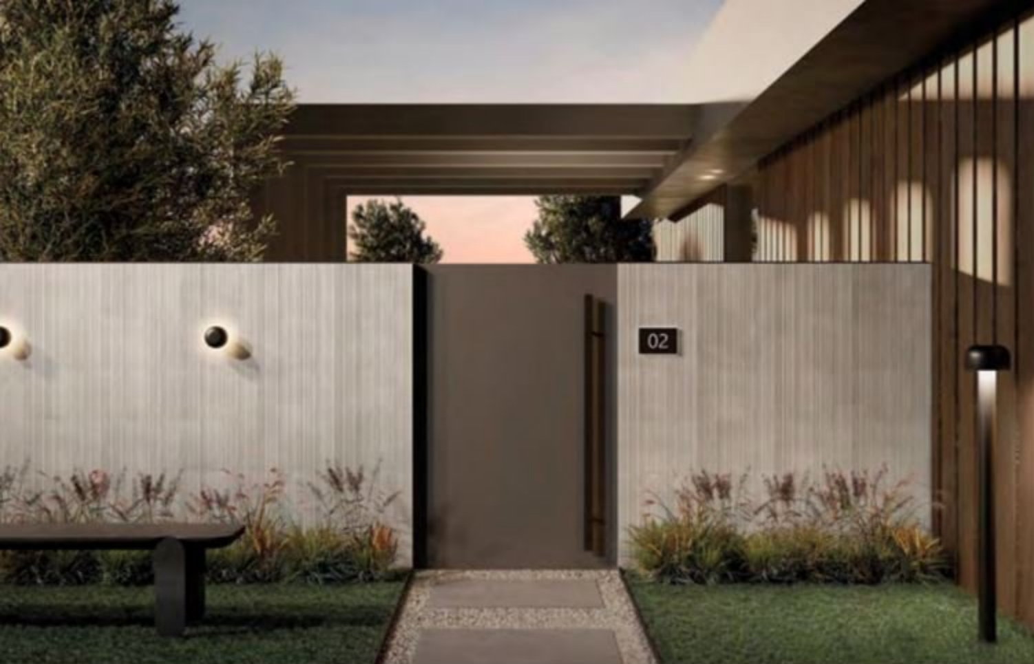
Wall Armor MD 01 Bianco NO SQ 300x450 / 12"x18" Floor MÖTLEY Woodstock MT 05 ST SQ 600x1200 / 24"x48" EVO_2/E 20 mm