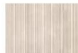
ARMOR MD 01 Bianco