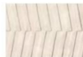
NORTH MD 01 Bianco