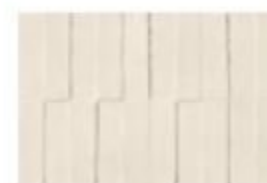
DAWN MD 01 Bianco