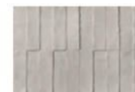
DAWN MD 02 Grigio