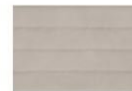
MELLOW MD 02 Grigio