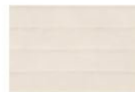
MELLOW MD 01 Bianco