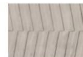
NORTH MD 02 Grigio